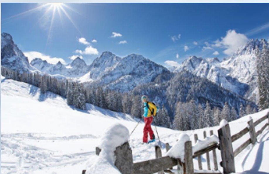
Skitouren sind beliebt in Osttirol: Ende Januar gibt es für Einsteiger und Profis geführte Safaris – bei meist traumhaft schönem Wetter.

24.-27. Januar: Beim 6. Skitourenfestival erleben Einsteiger und Profis an vier Tagen ein vielseitiges Programm mit geführten Skitourensafaris, Sicherheitstrainings, Materialtests und Fachvorträgen.