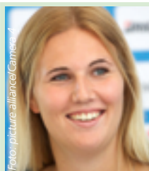
Christin Hussong Speerwurf-Europameisterin, Fan des 1. FC Kaiserslautern, tippt:

grün = Gewinnspiele 6aus45 Auswahltipp, * = Zusatzspiel, E = Ersatzauslösung