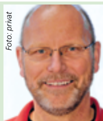
Hartmut Binder Pressebüro Binder Nürtingen, Fan der TG Nürtingen, tippt: