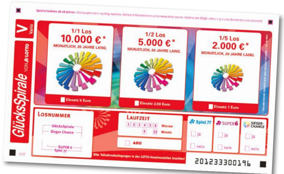
Das Vario-Los der GlücksSpirale ermöglicht Einsätze von 1 bis 5 Euro je Ziehung. Auch die Laufzeit ist variabel – von einer Woche bis zu einem ganzen Jahr.

Vormerken! Einfach so und mit Fortunas Unterstützung 5000 Euro Urlaubsgeld auf die Hand: Das könnte den Teilnehmern bei der GlücksSpirale am Samstag, 2. Februar, passieren. Dann werden im Rahmen einer bundesweiten Sonderauslosung zusätzlich 200 x 5000 Euro verlost.