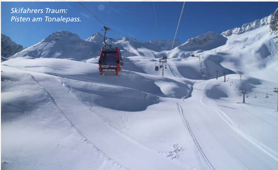
Skifahrers Traum: Pisten am Tonalepass.