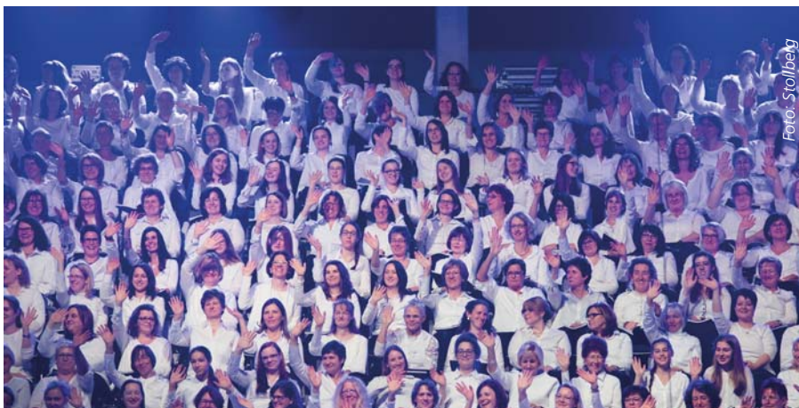
Für Gänsehaut-Stimmung sorgte der Luther-Chor in Stuttgart.

sammen mit der Evangelischen Kirche in Deutschland und weiteren Partnern bundesweit zehn Aufführungen – mit tausenden Sängerinnen und Sängern aus den Städten und Regionen.