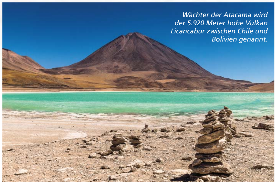
Wächter der Atacama wird der 5.920 Meter hohe Vulkan Licancabur zwischen Chile und Bolivien genannt.

Die Hügel sehen aus wie auf einem impressionistischen Gemälde. Wir begegnen Lamas, Alpakas und Flamingos. Der letzte Höhepunkt der Reise ist der Salar de Uyuni, der größte Salzsee der Erde. Für uns heißt es dann leider Abschied nehmen von dieser einmaligen Landschaft. Zehn Tage, drei Länder, knapp 6.000 Kilometer und einen geplatzten Reifen später hat uns das pulsierende Leben der 13-Millionen-Stadt Buenos Aires wieder.