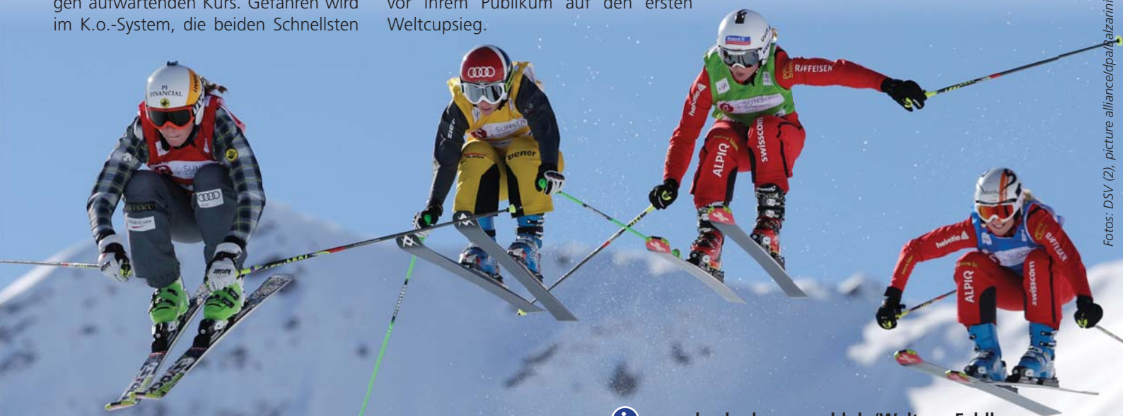
Auf dem Sprung an die Spitze: Heidi Zacher (2. v. li.) jagt die im Weltcup führende Olympiasiegerin Marielle Thompson (li.).

Übrigens: Das Glück spielt nicht nur bei den Ski- und Snowboardcrossern eine Rolle. Interessantes über Lotto Baden-Württemberg und das Spielangebot ist am Lottomobil zu erfahren, das an den Weltcup-Wochenenden am Feldberg von den Fans und Skisportlern besucht werden kann.