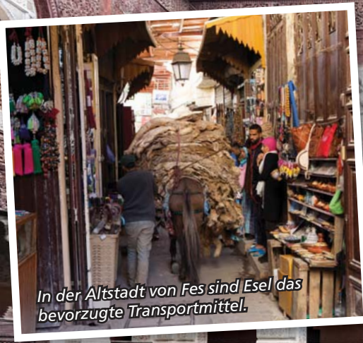
In der Altstadt von Fes sind Esel das bevorzugte Transportmittel.