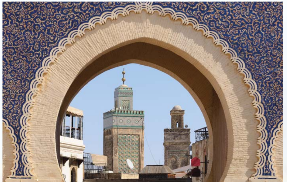
Durch das mit blauen Fliesen verzierte Bab Bou Jeloud-Tor geht der Blick vom Königspalast in die Medina von Fes.

Das mittelalterlich anmutende Fes ist die Stadt des Kunsthandwerks und reich an andalusisch-maurischer Architektur. Über 400 Moscheen, Medersen, Brunnen und andere Bauwerke prägen das Bild von Fes, das bis heute als religiöses und kulturelles Zentrum Marokkos gilt. Dafür steht vor allem die al-Qarawiyin-Universität. Die im 9. Jahrhundert gegründete Lehranstalt ist eine der ältesten Universitäten