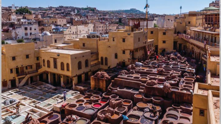
Das Färber- und Gerberviertel von Fes zählt zu den größten der Welt. Was romantisch wirkt, ist knochenhartharte Arbeit und alles andere als gesund.