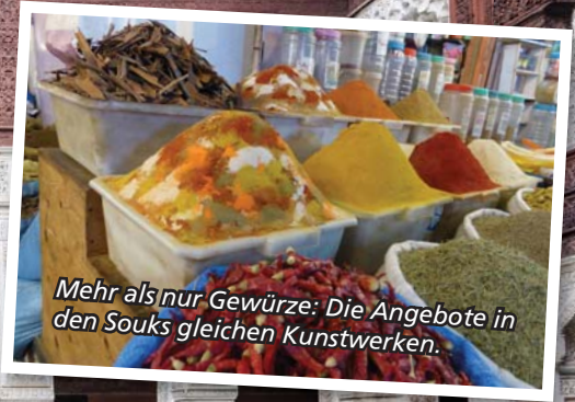
Mehr als nur Gewürze: Die Angebote in den Souks gleichen Kunstwerken.