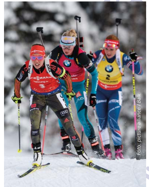
Medaillenverdächtiges Trio: Laura Dahlmeier vor Marie Dorin Habert und Gabriela Koukalova.

Fortsetzung in Hochfilzen? Bei den Frauen ist die Weltspitze ganz eng beieinander und der Favoritenkreis damit breit gestreut. Die besten Chancen neben Dahlmeier haben die Tschechin Gabriela Koukalova, die Finnin Kaisa Mäkäräinen und die Französin Marie Dorin Habert. Aber auch Laura Dahlmeiers Teamkolleginnen Vanessa Hinz, Franziska Hildebrandt, Maren Hammerschmidt und Fran-