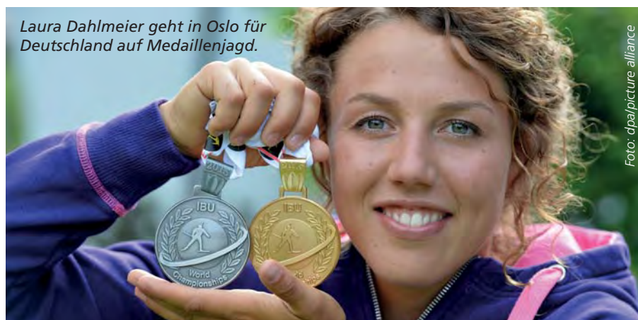
Laura Dahlmeier geht in Oslo für Deutschland auf Medaillenjagd.

te einen neuen Reiz, wollte eine neue Beziehung zur Waffe aufbauen. Die Änderung hat mich weiter gebracht.“ Neu war zu Saisonbeginn auch die knallig grüne Teamkleidung des Deutschen Skiverbandes. Die Staffel-Weltmeisterin von 2015 atmete auf, als sie erfuhr, dass die Laufanzüge farblich eher dezent wirken. „Als grüne Frösche müssen wir zum Glück nicht starten“, lacht die Oberbayerin, hält dann aber kurz inne und erinnert sich an ihren ersten Rennanzug: „Der war grün mit blau.“ Der Beginn einer großen Karriere!