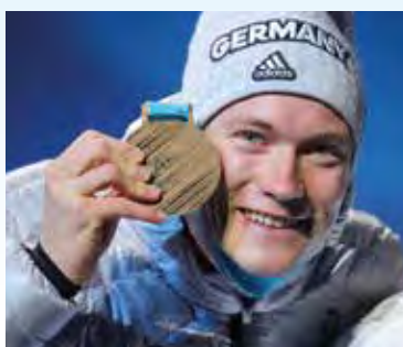
Benedikt Doll freut sich über Bronze in der Verfolgung und Staffel.

Unter den 154 deutschen Athleten waren 26, die in Baden-Württemberg geboren sind, hier leben oder für einen Verein aus dem Land starten. 14 der 26 gewannen Medaillen, drei standen sogar zweimal auf dem Treppchen!