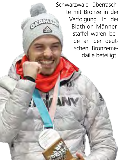
Der Nordische Kombinierer Fabian Rießle jubelt über Gold mit der Staffel und Silber im Einzelrennen.