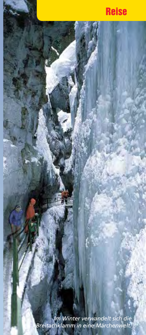
Im Winter verwandelt sich die Breitachklamm in eine Märchenwelt.