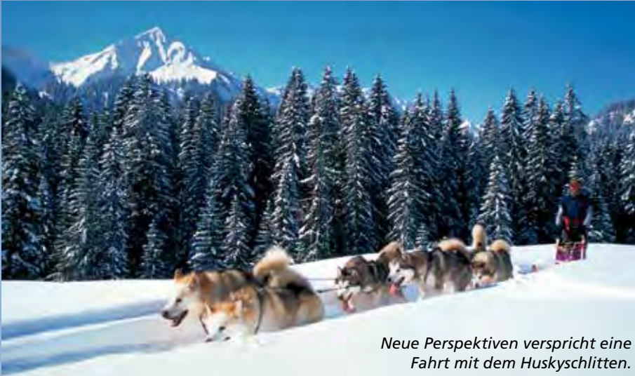
Neue Perspektiven verspricht eine Fahrt mit dem Huskyschlitten.

Ruhe. Im Kleinwalsertal kommen eben nicht nur Skifahrer und Snowboarder hoch hinaus, sondern auch Fußgänger.