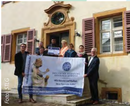
Einen GlücksSpirale-Scheck über 20.000 Euro gab es für die Sanierung der Kreuzstockfenster des Alten Pfarrhauses in Lauchheim.

D okumentiert wird die Unterstützung der GlücksSpirale durch die Übergabe von Schecks und Plaketten. Das war in den letzten Wochen in vielen Regionen Baden-Württembergs der Fall. Auf dieser Seite sind einige Beispiele abgebildet.