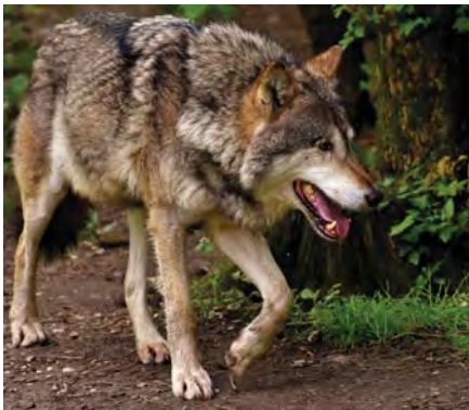
In nordöstlichen Regionen Deutschlands sind schon mehrere Wolfsrudel beheimatet. Im Ländle wurden bereits vereinzelte Tiere gesichtet.

Weitere Neuzugänge oder Rückkehrer unserer heimischen Tierwelt sind auf dieser Seite abgebildet.