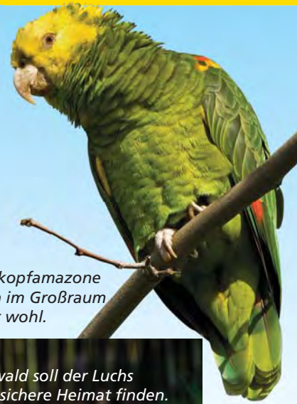
Die Gelbkopfamazone fühlt sich im Großraum Stuttgart wohl.

In Baden-Württemberg sagen sich Fuchs und Hase seit jeher gute Nacht. Doch immer mehr fremde Tiere finden hier eine neue Heimat oder kehren nach langer Zeit zurück. Das glüXmagazin nahm die Fährte auf und stellte fest: Ein Spaziergang durch unsere Wälder kann durchaus zu einer spannenden Safari werden – auch dank der vielfältiger gewordenen Tierwelt.