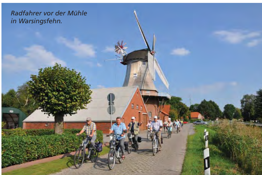
Radfahrer vor der Mühle in Warsingsfehn.

Mit nordischer Gemütlichkeit auf kleinem Raum punktet das 1.500-Einwohner-Dörfchen Oldersum. Dank der Religionsgespräche im Jahr 1526 gilt der Flecken als Wiege der ostfriesischen Reformation. Zu kleinen Attraktionen haben sich bei Urlaubern die Alte Waage, der heimelige Hafen und das Schöpfwerk gemauert. Mit einer Leistung von 30.000 Litern Wasser pro Sekunde war es einst das größte seiner Art und sorg-