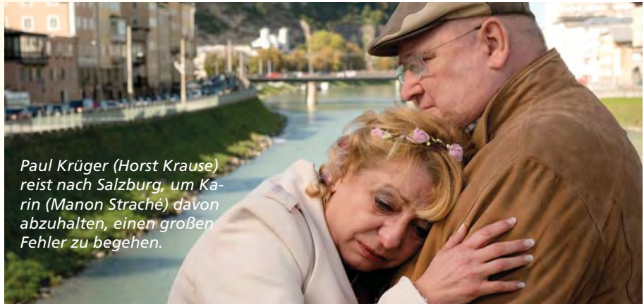
Paul Krüger (Horst Krause) reist nach Salzburg, um Karin (Manon Straché) davon abzuhalten, einen großen Fehler zu begehen.

Eine Ingwerknolle gegen die Seerkrankheit. Wo gibt's denn so was? Bei Manon Straché! Mit dem glüXmagazin plauderte die gut gelaunte Schauspielerin über die Dreharbeiten zu ihrem aktuellen Film „Küss die Hand, Krüger“, in dem sie am 10. März, 20:15 Uhr, an der Seite von Horst Krause im Ersten zu sehen ist.