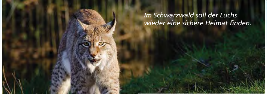
Im Schwarzwald soll der Luchs wieder eine sichere Heimat finden.

In Baden-Württemberg sagen sich Fuchs und Hase seit jeher gute Nacht. Doch immer mehr fremde Tiere finden hier eine neue Heimat oder kehren nach langer Zeit zurück. Das glüXmagazin nahm die Fährte auf und stellte fest: Ein Spaziergang durch unsere Wälder kann durchaus zu einer spannenden Safari werden – auch dank der vielfältiger gewordenen Tierwelt.