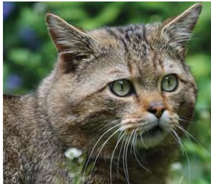
Auf leisen Pfoten kehrte die Wildkatze nach 100 Jahren in den Südwesten zurück, bevorzugt dabei den Schwarzwald und die Region Stromberg.