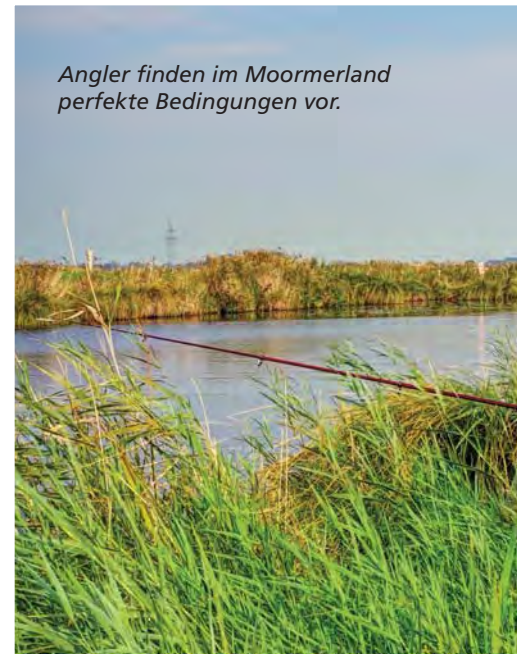
Angler finden im Moormerland perfekte Bedingungen vor.

Im Moormerland leben rund 23.000 Menschen. Die ostfriesischen Städte Emden, Aurich und Leer rahmen die Landgemeinde ein. Im Südwesten fließt die Ems. Urlauber schätzen die Wasser- und Radwege, die den Landstrich wie ein feines Netz durchziehen. Insgesamt gibt es acht Radrouten, die an allen Sehenswürdigkeiten vorbeiführen. In unmittelbarer Nähe verlaufen auch die Fehnroute, ein 165 Kilometer langer Radfernweg sowie der Friesische Heerweg aus dem 8. Jahrhundert.