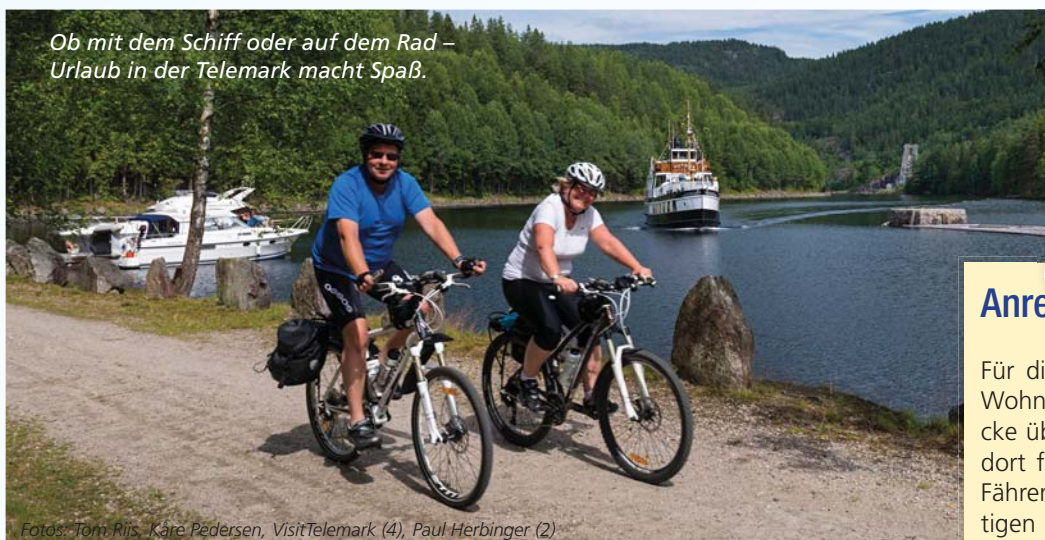
Ob mit dem Schiff oder auf dem Rad – Urlaub in der Telemark macht Spaß.