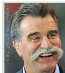
Heiner Brand Handball-Weltmeister als Spieler und Trainer, Fan des 1. FC Köln, tippt:

Form: s/S = Sieg, u/U = Unentschieden, n/N = Niederlage, kleine Buchstaben = Heimspiel, große Buchstaben = Auswärtsspiel, (F) = Frauen. Wertung nach der regulären Spielzeit (Verlängerungen werden nicht berücksichtigt). Zahlen in Klammern = Tabellenstand.