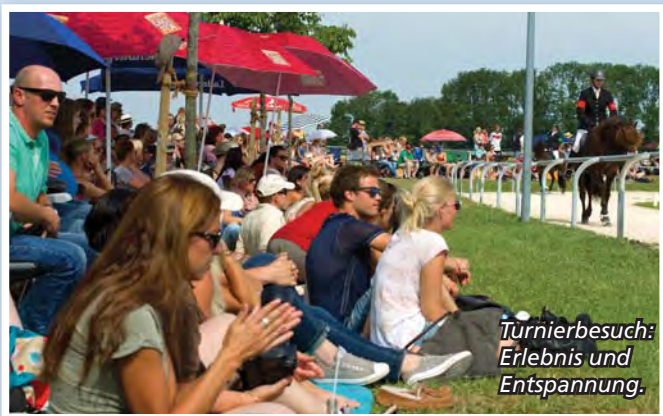
Turnierbesuch: Erlebnis und Entspannung.