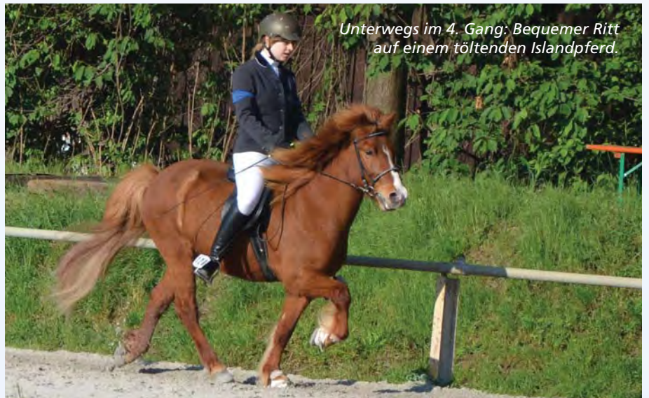
Unterwegs im 4. Gang; Bequemer Ritt auf einem töltenden Islandpferd.

Mitte der 50er-Jahre wurden die Vierbeiner aus dem hohen Norden durch die Immenhof-Filme auch in Deutschland bekannt. Dick (Angelika Meißner) und Dalli (Heidi Brühl) erlebten ihre Abenteuer auf dem Rücken von Islandpferden. Eine größere Verbreitung fanden die „Isis“ aber zunächst nicht, da das Pferd seine Bedeutung als Arbeitstier verlor und Reitpferde zum Luxusgut wurden.