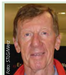
Walter Röhl Rallye-Weltmeister 1980 und 1982, Rennfahrer-Legende, Bayern-Fan, tippt:

* = remisverdächtig ** = stark remisverdächtig *** = Das Spiel 28 wurde verlegt. Für dieses Spiel gilt daher das Ergebnis der Ersatzauslösung.