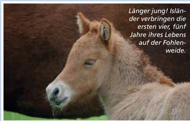
Länger jung! Isländer verbringen die ersten vier, fünf Jahre ihres Lebens auf der Fohlenweide.

man. Da das Pferd alle vier Hufe gleichmäßig nacheinander aufsetzt, ergibt sich ein Viertakt. Längere Strecken werden gern im Tölt zurückgelegt, weil der für den Reiter sehr bequem ist. Im Pass stößt sich das Pferd im Wechsel links und rechts mit jeweils beiden Beinen kräftig vom Boden ab und wird bis zu 60 km/h schnell – was alles andere als angenehm für den Reiter, aber umso spektakulärer für die Zuschauer ist.