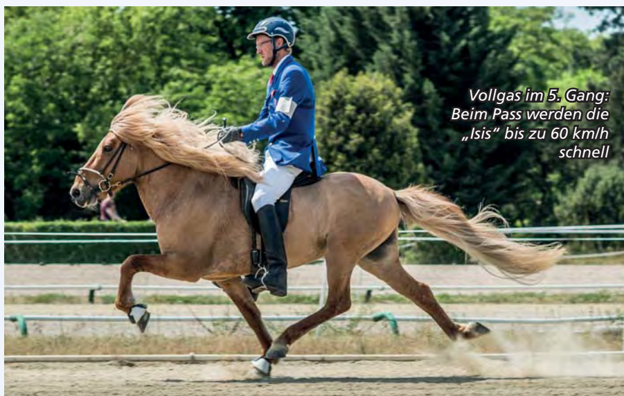
Vollgas im 5. Gang: Beim Pass werden die „Isis“ bis zu 60 km/h schnell

Spaß bei diesen Veranstaltungen haben nicht nur Pferdekenner. Abwechslungsreiche Programmpunkte und eine ebenso friedliche wie fröhliche Atmosphäre machen die Turniere zu einem Event für Groß und Klein. Beim Bummel durch die