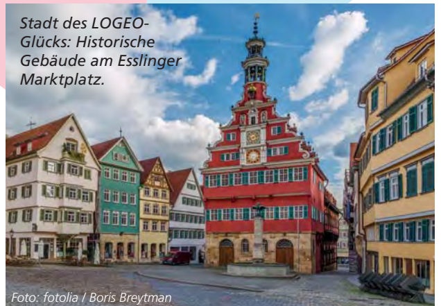
Stadt des LOGEO-Glücks: Historische Gebäude am Esslinger Marktplatz.

Im Internet können registrierte Tipper bereits auf der Startseite von lotto-bw.de einen LOGEO-Tipp spielen. Im Gewinnfall kommt per E-Mail eine Gewinnmeldung. Annahmeschluss ist Sonntag um 23:59 Uhr, die Ziehung erfolgt am Montagmorgen.