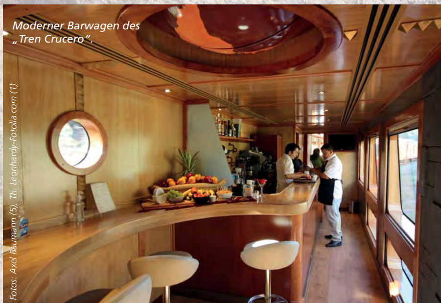
Moderner Barwagen des „Tren Crucero“.

Gemächlich zuckelt der Zug auf der „Avenida de los Volcanes“ Richtung Süden. Forscher Alexander von Humboldt prägte für die Gebirgsformationen einst den Namen „Straße der Vulkane“, denn eine Allee von aktiven und erloschenen Feuerbergen säumt die Bahntrasse. Dominierend reckt sich in der Ferne der Cotopaxi mit 5897 Metern gen Himmel. Der höchste Punkt der Strecke ist der Bahnhof Urbina – beachtliche 3600 Meter über dem Meeresspiegel.