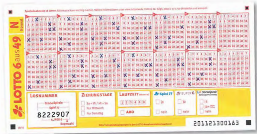
Auf diesem Schein ist das unten vorgestellte Kürzungssystem für acht Zahlen und zwölf Euro Einsatz in zwölf Spielfeldern eines Normalscheines ausgeschrieben. Dabei wurden die Zahlen der Grundform (1 bis 12, siehe unten) durch folgende Glückszahlen ersetzt: 1 = 3, 2 = 13, 3 = 20, 4 = 21, 5 = 29, 6 = 32, 7 = 38, 8 = 43. Jede Zahl erscheint bei diesem Kürzungssystem neunmal.

Das glüXmagazin bildet jeweils das Grundschema der Systeme ab. Beim 8-Zahlen-System wird daher die Grundform mit den Zahlen 1 bis 8 dargestellt, beim 16-Zahlen-System sind es die Zahlen 1 bis 16. Falls Sie Ihr Glück mit einem dieser Systeme und Ihren persönlichen Glückszahlen versuchen wollen, müssen Sie die Zahlen der Grundform durchgängig mit Ihren eigenen Glückszahlen ersetzen. Wollen Sie beispielsweise statt der 9 die 42 spielen, kreuzen Sie überall dort, wo die 9 steht, die 42 an. Weitere Kürzungssysteme stellen wir Ihnen auf Wunsch gern zur Verfügung.