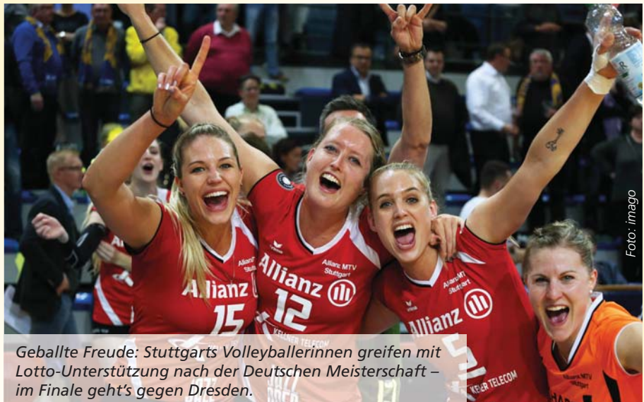
Geballte Freude: Stuttgarts Volleyballerinnen greifen mit Lotto-Unterstützung nach der Deutschen Meisterschaft – im Finale geht's gegen Dresden.