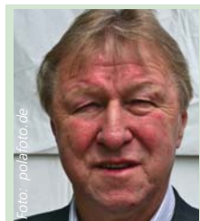
Horst Hrubesch Trainer der DFB-U 21, Europameister 1980, Fan des Hamburger SV, tipp:

* = remisverdächtig ** = stark remisverdächtig