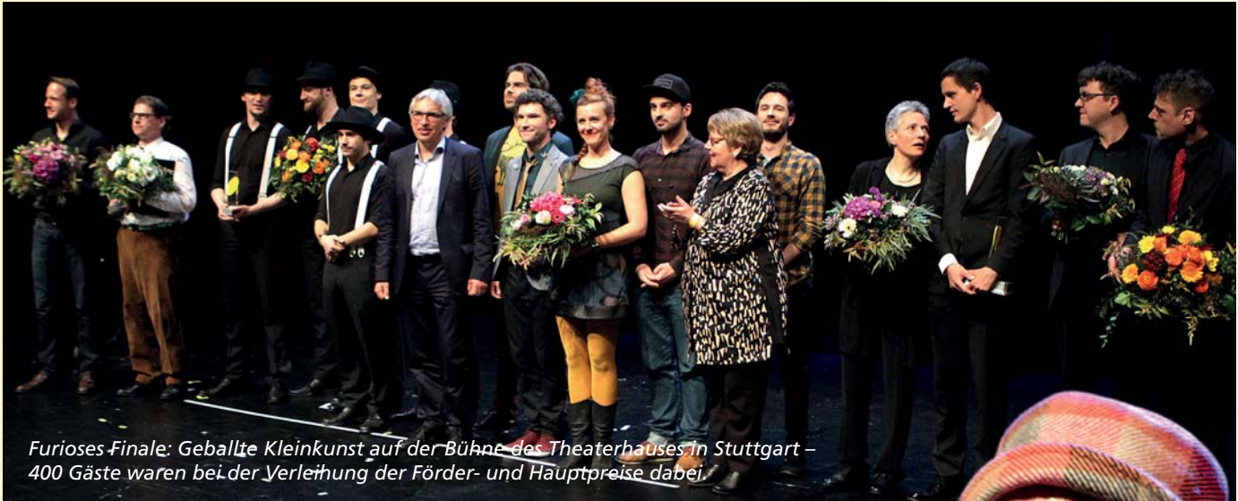
Furioses-Finale: Geballte Kleinkunst auf der Bühne des Theaterhauses in Stuttgart – 400 Gäste waren bei der Verleihung der Förder- und Hauptpreise dabei.

de Forelle eine Symbiose mit einem Krokodil – indem sie gefressen wird. Fortmeier setzt seiner handfertigen Kunst noch seine ulkigen Stimmen obendrauf. Der Kleinkunstpreisträger 2016 ist ein Alleskönner in Sachen Kleinkunst, überzeugt auch „als exzellenter Pantomime und Bauchredner“, wie Moderator Bernd Kohlhepp betonte.