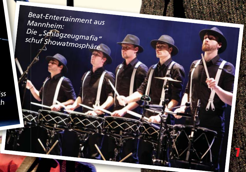
Beat-Entertainment aus Mannheim: Die „Schlagzeugmafia“ schuf Showatmosphäre.