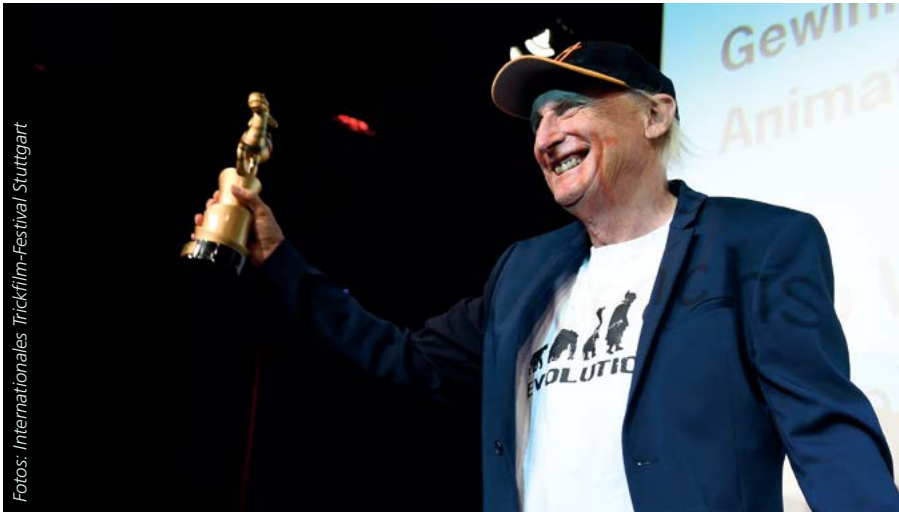
Her mit dem Ding... den „Trickstar“ stellt Kult-Komiker Otto, der als Synchronsprecher tolle Erfolge feiert, ins Ottomuseum im heimischen Emden.

Der Typ ist irre... Otto, Kult-Komiker aus Emden, hat auch mit über 70 noch nicht genug. In Stuttgart schnappte sich der Schauspieler den „Trickstar“, die Trophäe als bester Synchronsprecher von Animationsfiguren. Dem schmerbauchigen „Grinch“, einem griesgrämigen Weihnachtsmuffel, verlieh der Wahl-Hamburger eine besonders einfühlsame Stimme. Die Jury war begeistert – und Ostfrieese Otto bei der Verleihung platt!