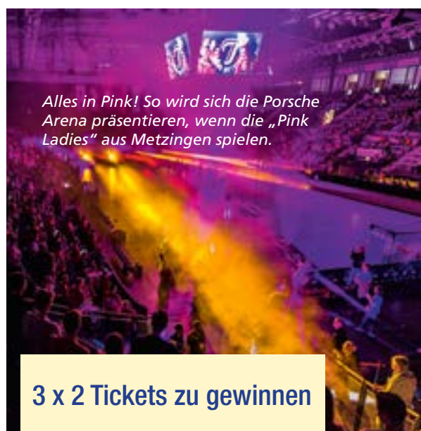
Alles in Pink! So wird sich die Porsche Arena präsentieren, wenn die „Pink Ladies“ aus Metzingen spielen.