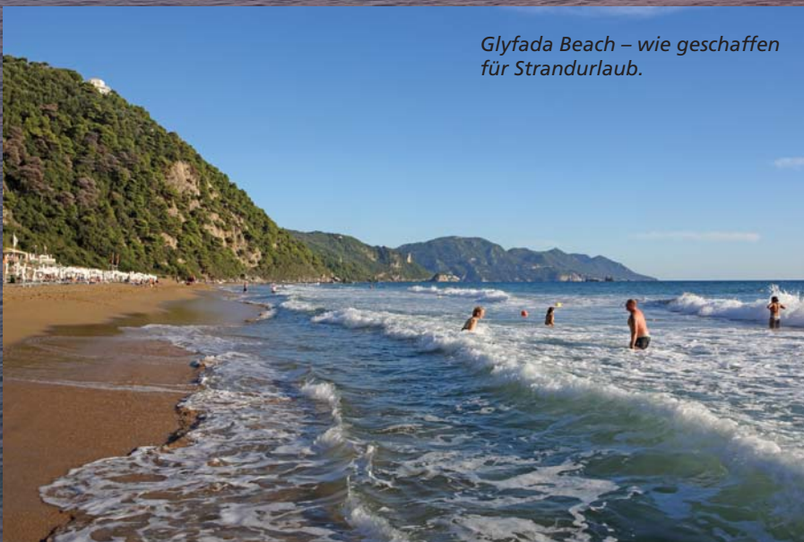
Glyfada Beach – wie geschaffen für Strandurlaub.

Es war Anfang Oktober, als ich hier war. Das Meer war noch immer 24 Grad warm, manchmal goss es wie aus Kübeln. Die meiste Zeit aber schien die Sonne, erleuchtete das Laub und die majestätischen gelben Trichter der Trompetenbäume. Die Natur, gelöst vom Wür-