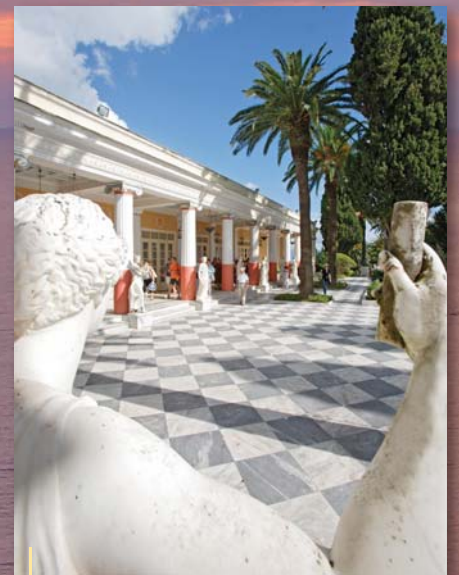
Achilleion – diesen prächtigen Palast ließ Österreichs Kaiserin Sisi zwischen 1890 und 1892 bauen.

Neuerdings zieht es vermehrt Stars auf die Insel. Hinter vorgehaltener Hand und