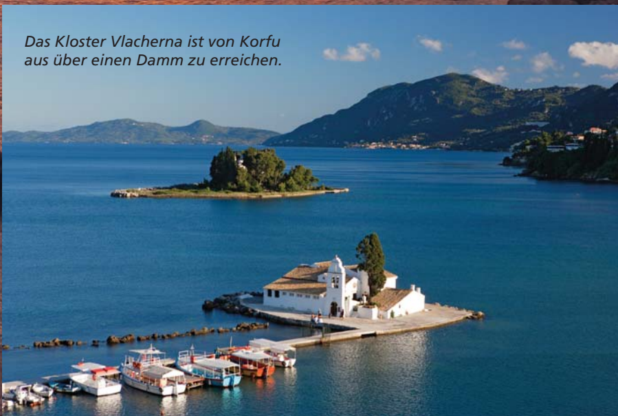
Das Kloster Vlacherna ist von Korfu aus über einen Damm zu erreichen.

küste (Glyfada, Pelekas und Gardaki Beach) wird mit unvergesslich schönen Sonnenuntergängen belohnt. Auf Nebenstrecken ist allerdings Vorsicht geboten. Manchmal gehört die Straße Schafen und Ziegen oder die Erosion lässt Fahrbahnen einfach verschwinden. Ich erwähne das nur, damit Sie Ihren Mietwagen am Flughafen mit einem entspannten „No Problem!“ zurückgeben können.