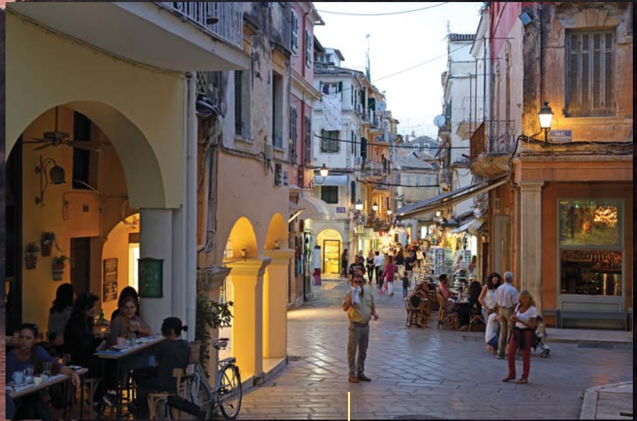
Voll das Leben: Abendlicher Bummel durch die Altstadt von Kerkyra.

Um das exponierte Angelokastro in Paleokastritza zu besteigen und das malerische Vlacherna-Kloster bei Korfu Stadt zu sehen, habe ich mir ein Auto