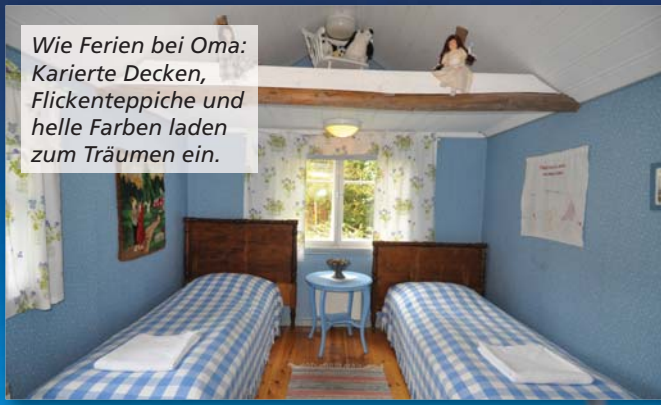
Wie Ferien bei Oma: Karierte Decken, Flickenteppiche und helle Farben laden zum Träumen ein.