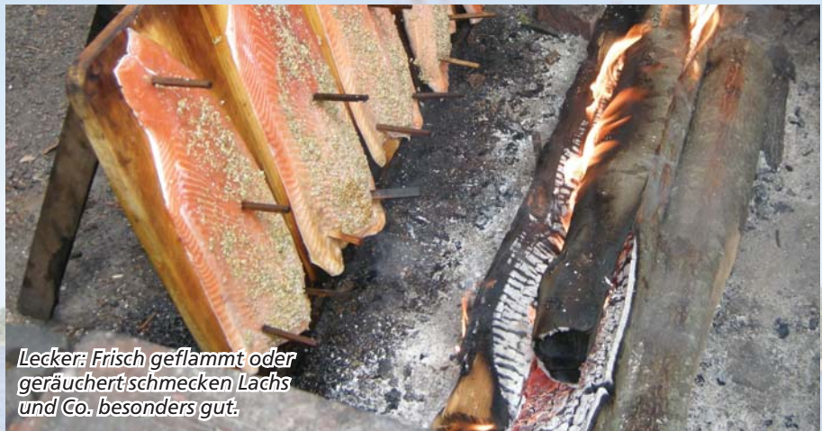
Lecker: Frisch geflammt oder geräuchert schmecken Lachs und Co. besonders gut.

Abends wird es in Finnland auch im Sommer gerne mal kühl. Das ist kein Problem in Herrankukkaro. In der Ferienanlage steht die größte Erd-Rauchsauna der Welt. Hier schwitzen bis zu 124 Menschen gemeinsam. Die Wärme der Rauchsauna gilt als besonders weich und mild. Für die Abkühlung danach gibt es dann frisches Meerwasser. Beim gemeinsamen Frieren und Schwitzen kommen wir schnell mit anderen Gästen ins Gespräch. In diesem Jahr freuen sich viele auf die größten Segelschiffe der Welt, die bald in Turku vor Anker gehen.