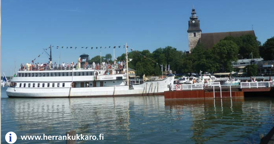
Das Dampfschiff Ukkopekka verbindet Turku mit dem Seebad Naantali.

Mehr als 80 Betten gibt es in Herrankukkaro. Die schlichten Zimmer erinnern an Ferien auf dem Bauernhof oder auch früher bei Oma und Opa. Blumen auf den Vorhängen, verspielte Wandbehänge oder weißblau karierte Tagesdecken und solide Holzböden samt Flickenteppichen zaubern eine behagliche Atmosphäre. Und dazu dieser unnachahmlich frische Geruch nach Harz und Meer.