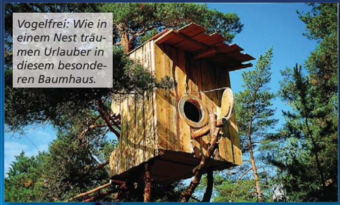
Vogelfrei: Wie in einem Nest träumen Urlauber in diesem besonderen Baumhaus.

nen. Nach ausgedehnten Touren gibt es Leckeres aus der Region. Die Beeren und Pilze stammen aus den umliegenden Wäldern. Der Fisch durfte vor kurzem noch vor der Küste der Insel schwimmen und wird nun im Rauchofen zubereitet. Zu den besonderen Spezialitäten gehören das selbstgebackene Brot und die Sanddornbutter.