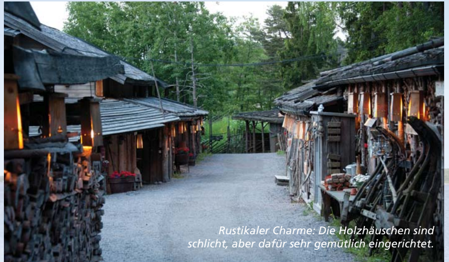
Rustikaler Charme: Die Holzhäuschen sind schlicht, aber dafür sehr gemütlich eingerichtet.

Es gibt einen Ort, wo statt des Radios die Vögel singen und der Fernseher angesichts der Schönheit der Natur einfach verblasst – Herrankukkaro. Das ehemalige Fischerdorf liegt auf der Insel Aïrismaa inmitten des Archipelagos zwischen Finnland und Schweden. Mehr als 40.000 Inseln gehören zu diesem skandinavischen Naturwunder. Hier gibt es, was im Alltag so häufig fehlt: Entspannung und echtes Wohlbefinden.