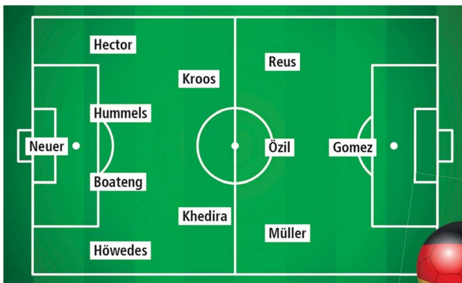
Die Elf des glüXmagazins für Frankreich: Gegenüber dem WM-Finale 2014 gibt es vier personelle Änderungen: Der lange verletzte Bastian Schweinsteiger, Philipp Lahm, Christoph Kramer und Miroslav Klose sind hier nicht mehr berücksichtigt.

Nach dem Rücktritt von Miroslav Klose in der Nationalmannschaft rief Ma-