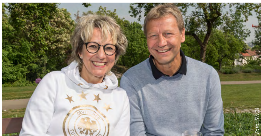
Doppelpass von Petra Klein und Guido Buchwald: Am Mittwoch, 27. Juni (16 Uhr), kreuzt die beliebte SWR1-Moderatorin zusammen mit dem Weltmeister beim Spiel der deutschen Nationalmannschaft gegen Südkorea in einem baden-württembergischen Verein auf – jetzt im Internet auf swr1.de bewerben.

D er gebürtige Berliner Guido Buchwald, längst im schwäbischen Walldorfhäslach zu Hause, war sofort Feuer und Flamme: „Da muss ich nicht erst lange überlegen, freilich bin ich dabei!“ Teilnehmen an der Aktion von SWR und von Lotto Baden-Württemberg