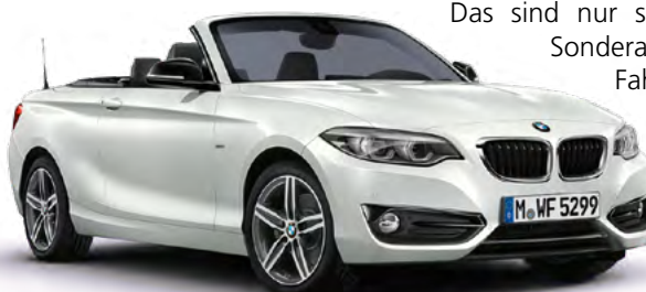
Bei den abgebildeten Autos handelt es sich um Modellbeispiele. Farbe und Ausstattung bleiben vorbehalten.