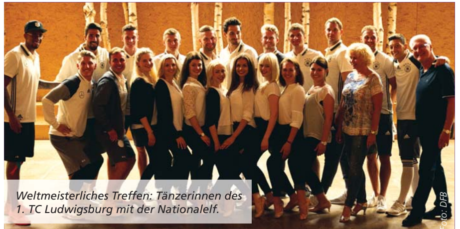
Weltmeisterliches Treffen: Tänzerinnen des 1. TC Ludwigsburg mit der Nationalelf.

Ruhig zupacken! So lautete Devise von Erfolgscoach Norman Beck. Seine Tänzerinnen ließen sich nicht lange bitten und zeigten Özil, Müller, „Schweini“ und Co. wie der Hase läuft. Weltmeister und Weltmeisterinnen hatten viel Spaß, als letzte Woche 27 Tänzerinnen aus Ludwigsburg im EM-Quartier der DFB-Elf auftauchten.