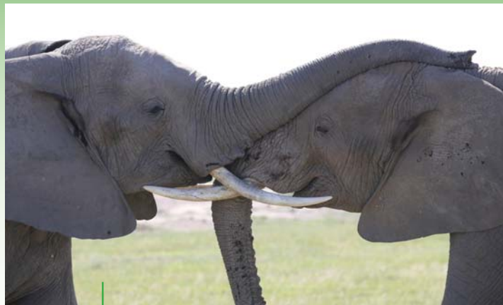
Riesen mit großen Gefühlen: Innige Elefanten-Umarmung.