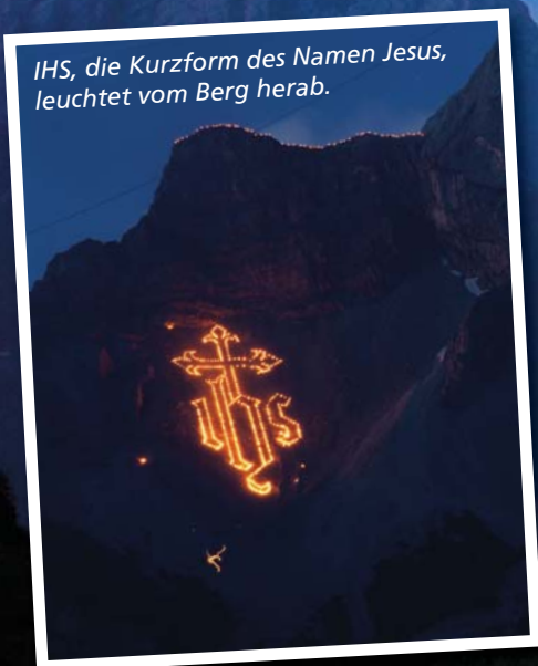
IHS, die Kurzform des Namen Jesus, leuchtet vom Berg herab.

Am Tag des Sonnwendfeuers steigen die einzelnen Gruppen morgens auf die Berge und stellen die Säckchen oder Be-