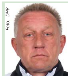
Michael Biegler Handball-Bundestrainer der deutschen Frauen, tippt:

Spiele 1-13 = TOTO 13er-Tipp Spiele 1-45 = TOTO 6aus45 Auswahltipp Spiele 1-11 = UEFA EURO in Frankreich Spiele 14-45 = Meisterschaftsspiele Spiele 14-23 = 1. Liga USA/MLS Spiele 24-33 = 1. Liga Brasilien Spiele 34-36 = 1. Liga Finnland Spiele 37-43 = 2. Liga Norwegen Spiele 44-45 = 2. Liga Schweden Form: s/S = Sieg, u/U = Unentschieden, n/N = Niederlage, kleine Buchstaben = Heimspiel, große Buchstaben = Auswärtsspiel, (F) = Frauen. Wertung nach der regulären Spielzeit (Verlängerungen werden nicht berücksichtigt). Zahlen in Klammern = Tabellenstand.