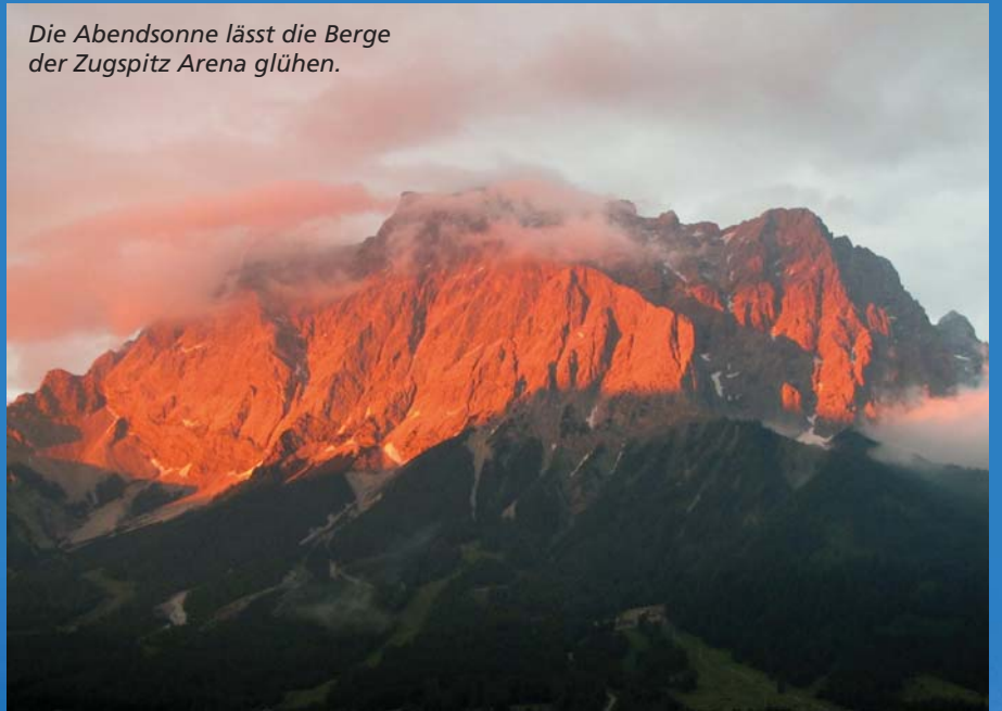
Die Abendsonne lässt die Berge der Zugspitz Arena glühen.

„Mit der Motivplanung beginnen wir im April. Themen sind Kreuze, betende Hände, Madonnen, Herzen, Hirsche, Rehe, Bären“, erzählt Somweber. „Von der Figur mache ich eine Zeichnung.