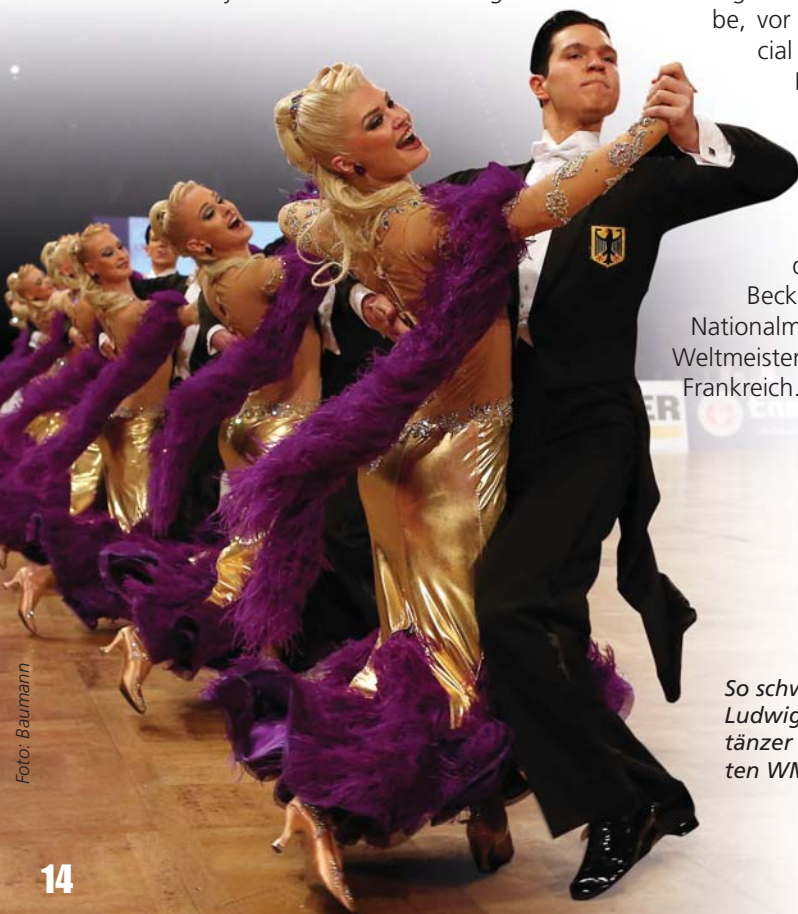
So schwungvoll holten die Ludwigsburger Formations-tänzer 2015 ihren bereits elften WM-Titel.