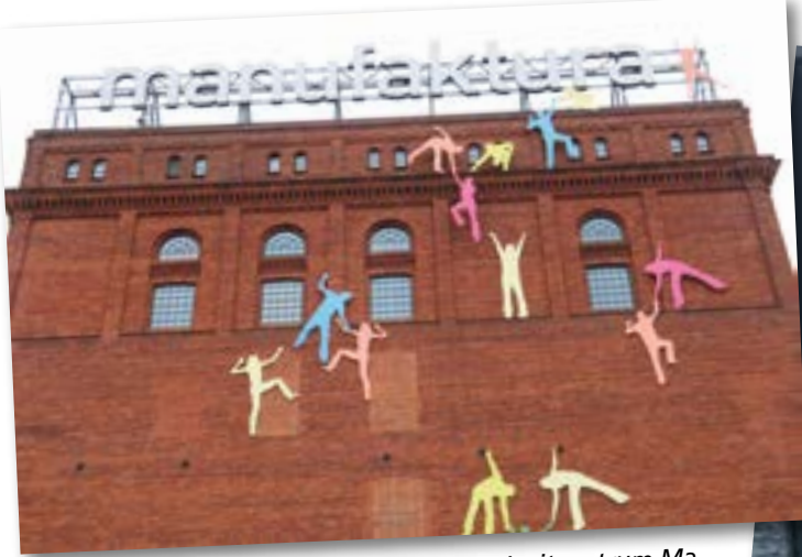
Keine Angst: Wer das Shopping- und Freizeitzentrum Manufaktura besuchen will, muss kein Kletterkünstler sein.