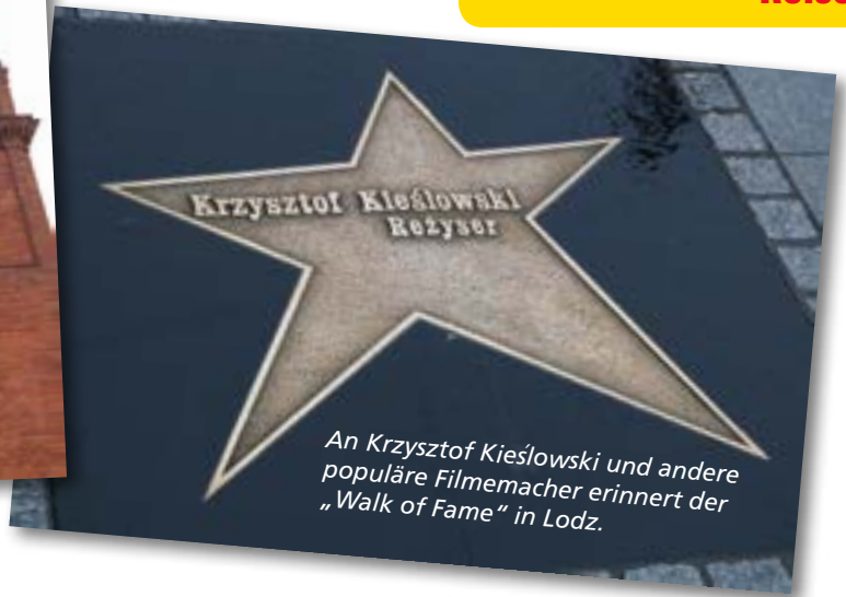
An Krzysztof Kieślowski und andere populäre Filmemacher erinnert der „Walk of Fame“ in Lodz.

und ursprünglichen Besitzer der Fabrik, die Stadtgeschichte erkunden und erahnen, wie prunkvoll die Textilfabrikanten einst lebten.