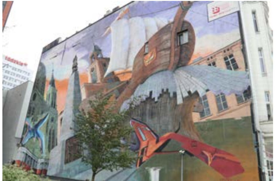
Lodz heißt übersetzt Schiff/Boot. Genau darauf zielt dieses überdimensionale Graffiti ab: Ein Segelschiff vor städtischer Kulisse

„Ich habe diese Landluft satt, will endlich wieder in die Stadt“, so trällerte einst Vicky Leandros in ihrem Hit „Theo, wir fahren nach Lodz“. In den vergangenen Jahrzehnten freilich haben viele Theos, aber auch viele Piotrs, Aleksanders und Zuzannas die ostpolnische Metropole verlassen. Lodz, der Name wird in Polen übrigens „Ütsch“ ausgesprochen, war lange eine schrumpfende Stadt. Von rund 850.000 Einwohnern im Jahr 1988 sank die Zahl auf derzeit etwa 690.000.