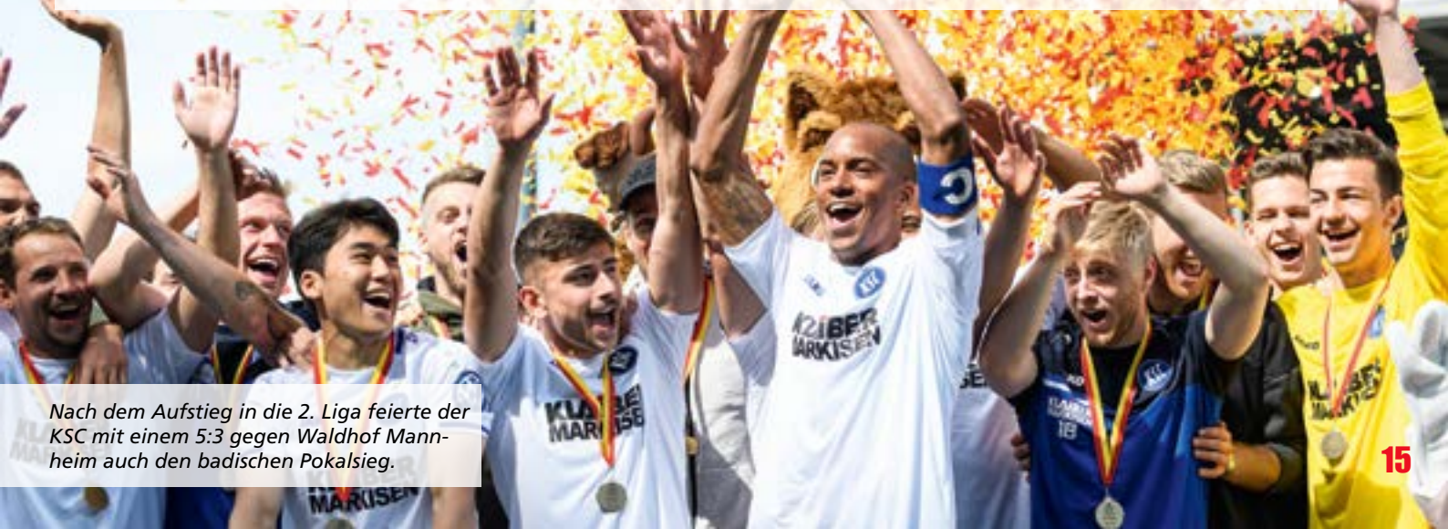
Nach dem Aufstieg in die 2. Liga feierte der KSC mit einem 5:3 gegen Waldhof Mannheim auch den badischen Pokalsieg.