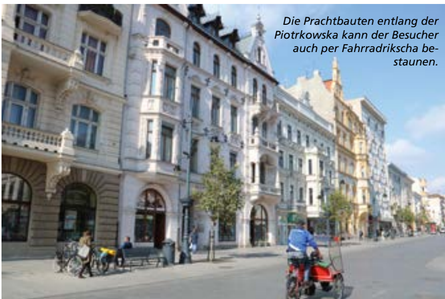
Die Prachtbauten entlang der Piotrkowska kann der Besucher auch per Fahrradrickscha bestaunen.

und Baumwolllager finden sich dort nun mehr als 200 Geschäfte, sowie Tanz- und Bowlingzentren, Fitnessstudios und Kinos, Restaurants und Cafés, ein Theater und ein Karussell. Ein auf dem Dach der ehemaligen Spinnerei gelegener Tank, früher von der Werksfeuerwehr als Behälter für Löschwasser genutzt, dient heute als Glasboden-Panorama-Swimmingpool eines Luxushotels.