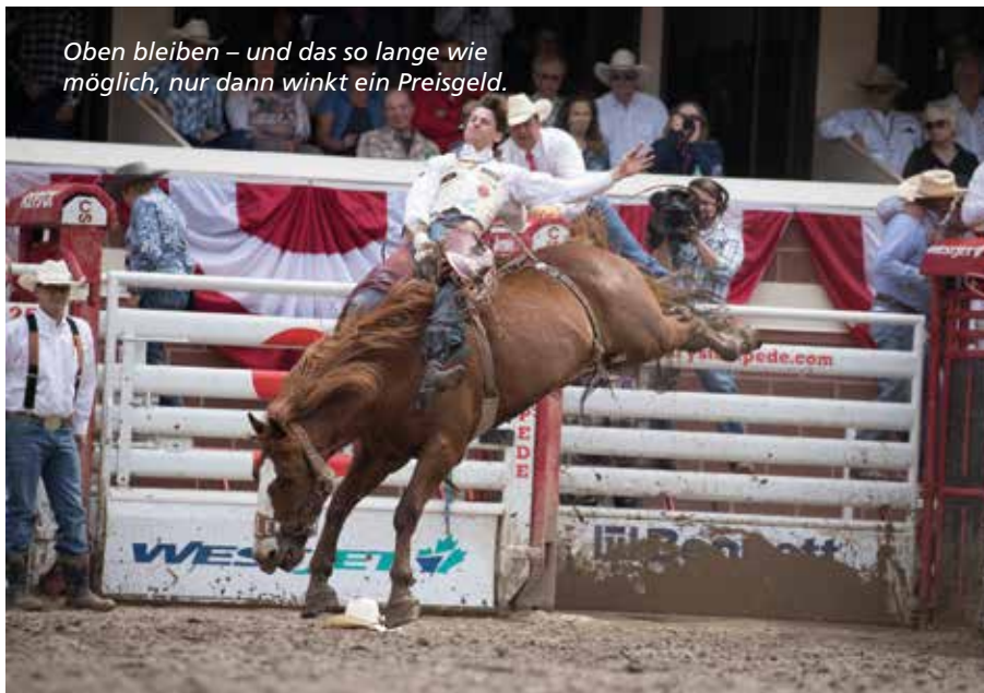
Oben bleiben – und das so lange wie möglich, nur dann winkt ein Preisgeld.