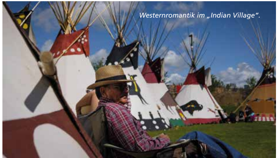
Westernromantik im „Indian Village“.

L os geht es jedes Jahr am ersten Freitag im Juli. Dann fließt beim großen Eröffnungsfrühstück der Stampede-Saison der Ahornsirup in Strömen. Mit Pfannkuchen in allen Variationen stimmen sich die Kanadier und Gäste aus aller Welt auf zehn turbulente Tage ein. Schon früh am Morgen füllen sich die Straßenränder mit Campingstühlen und Picknickdecken. Wenn sich die Eröffnungsparade um 9 Uhr in Bewegung setzt, brandet Jubel auf. Reiterstaffeln aus aller Welt, Indianer, Tanzgruppen und Vereine ziehen durch Downtown Calgary. Der Ernst in den Gesichtern zeigt, wie wichtig die kommenden Tage für die Stadt sind. Wer wird wohl die wichtigsten Wettbewerbe gewinnen? Welche Prominenten schauen dieses Jahr vorbei? Die Menschen am Straßenrand sind auf alles vorbereitet. Breite Hüte, Fransenwesten und Cowboystiefel sind absolut en vogue.