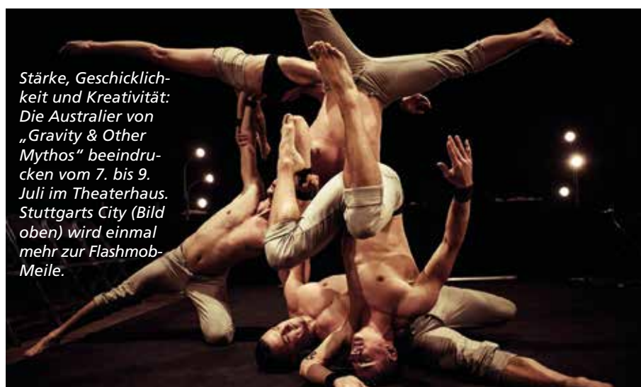
Stärke, Geschicklichkeit und Kreativität: Die Australier von „Gravity & Other Mythos“ beeindruckten vom 7. bis 9. Juli im Theaterhaus Stuttgarts City (Bild oben) wird einmal mehr zur Flashmob-Meile.