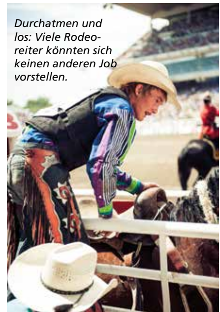
Durchatmen und los: Viele Rodeoreiter könnten sich keinen anderen Job vorstellen.