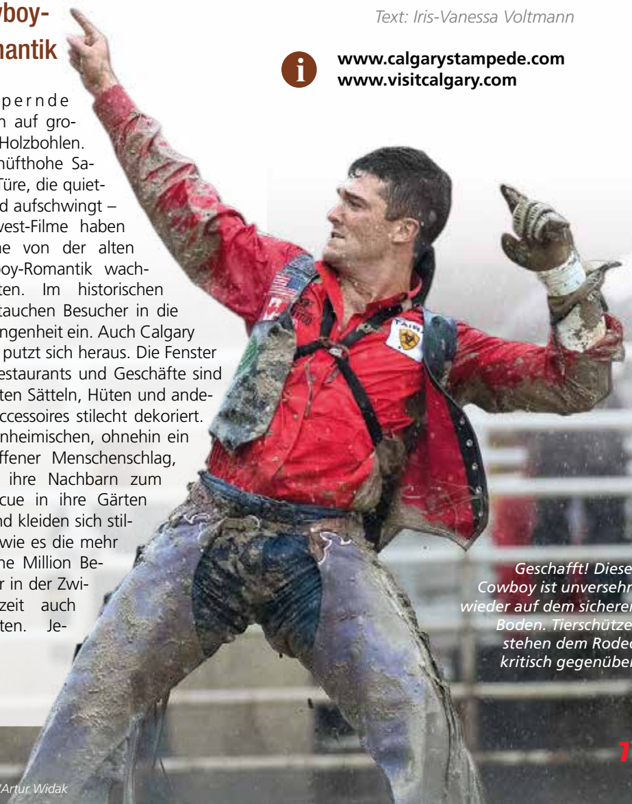
Geschafft! Dieser Cowboy ist unversehrt wieder auf dem sicheren Boden. Tierschützer stehen dem Rodeo kritisch gegenüber.

www.calgarystampede.com www.visitcalgary.com