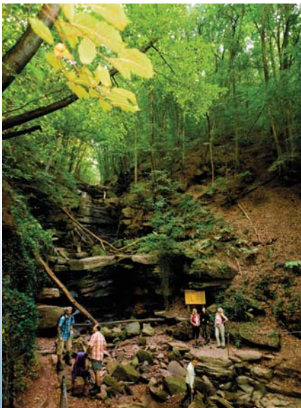
Odenwald pur! Die Margarethenschlucht bei Neckargerach.

In mittelalterlichen Burgen und Schlössern können Besucher auf den Spuren von Rittern und Prinzessinnen wandeln. Mit dem Auto nur 20 Minuten von der Schlucht entfernt liegt hoch über dem Neckartal Burg Hornberg. Diese wurde durch den berühmten „Ritter mit der Eisernen Hand“, Götz von Berlichingen, berühmt. Johann Wolfgang von Goethe berichtet in seinem Schauspiel von dem streitbaren Burgherrn. Direkt an Hornberg vorbei führt der im glüXmagazin 32/2016 vorgestellte „Neckarsteig“ – einer der schönsten und abwechslungsreichsten Weitwanderwege in Deutschland.