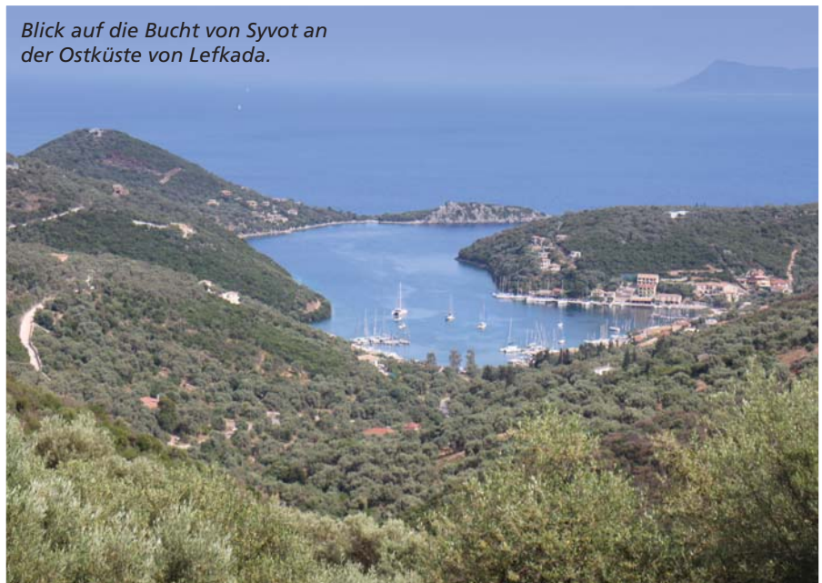
Blick auf die Bucht von Syvot an der Ostküste von Lefkada.