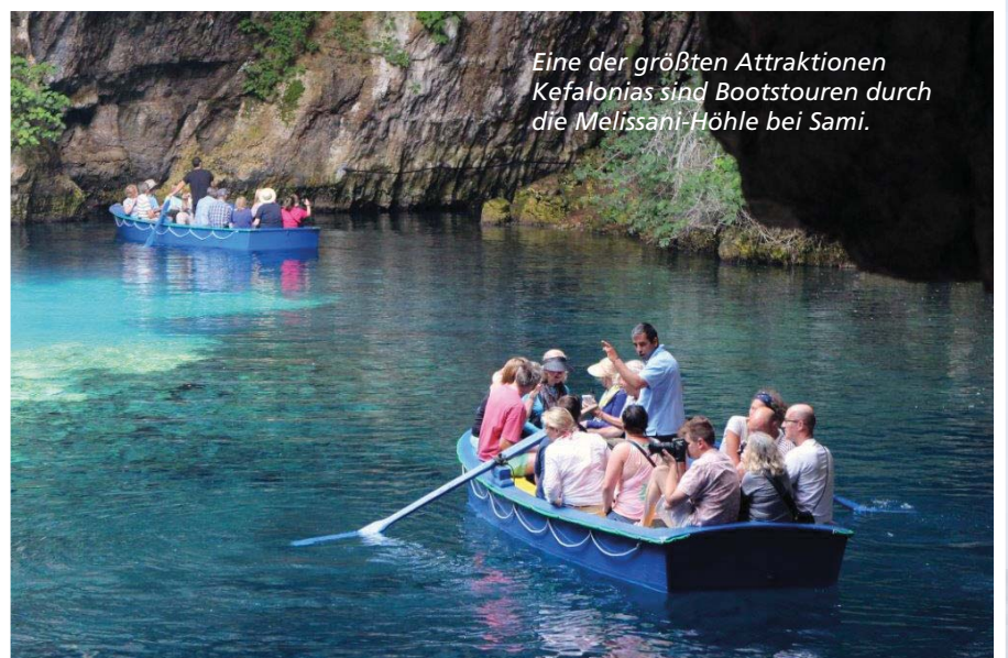
Eine der größten Attraktionen Kefalonias sind Bootstouren durch die Melissani-Höhle bei Sami.

die einige Taucher schnorcheln. „An die 600 unechte Karettschildkröten gibt es in diesem Gebiet. Von der echten Karettschildkröte unterscheidet sich die ‚Caretta caretta‘ durch einen größeren Kopf und, dass sie fünf statt vier Paar Rippen-schilde aufweist“, erklärt Giórgos. Plötzlich taucht ein mächtiger dunkler Schatten an der Backbordseite auf. Für ein paar Sekunden ragt ein schmaler Kopf aus dem Wasser. Schon ist das scheue Tier mit den enormen Bein-Paddeln wieder untergetaucht. Die „Caretta caretta“ ist das Symbol von Zakynthos und eine Haupttouristenattraktion neben Sonne, hellgelben Sand- und Kieselstränden, sanften, grünen Höhenrücken und einem Meer, das in allen Schattierungen zwischen Blau und Grün leuchtet.