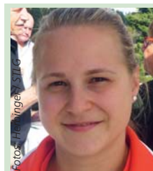
Sabine Kusterer Deutschlands beste Gewichttheberin, Olympia-Zehnte in Rio, tippt:

Form: s/S = Sieg, u/U = Unentschieden, n/N = Niederlage, kleine Buchstaben = Heimspiel, große Buchstaben = Auswärtsspiel, (F) = Frauen. Wertung nach der regulären Spielzeit (Verlängerungen werden nicht berücksichtigt). Zahlen in Klammern = Tabellenstand.