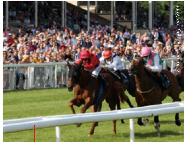
Tolle Atmosphäre in Iffezheim: Spannende Rennen, begeisterte Fans.