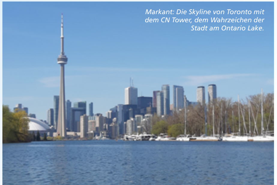
Markant: Die Skyline von Toronto mit dem CN Tower, dem Wahrzeichen der Stadt am Ontario Lake.

sich schließlich die Türen öffnen. Sie geben ein unbeschreibliches Panorama frei. Das sogenannte „Look Out Level“ wurde kürzlich vollständig verglast. Vor dem 360-Grad-Panorama tummeln sich Besucher mit Selfie-Sticks und bemühen sich um das beste Foto. Schwerelos soll das Ergebnis nach Möglichkeit aussehen. Tower-Guide Steven hat Tipps für die jährlich rund zwei Millionen Besucher parat. Er platziert sie so, dass weder Glas noch Beton auf dem Bild zu erkennen sind.