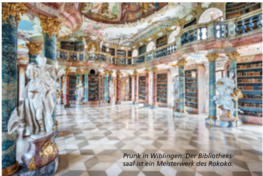
Prunk in Wiblingen: Der Bibliothekssaal ist ein Meisterwerk des Rokoko.

U lms touristischer Trumpf ist das berühmte Münster. Im Süden der Stadt findet sich aber mit dem imposanten Kloster Wiblingen eine weitere großartige Sehenswürdigkeit. Das Kloster wartet mit prachtvollen Räumlichkeiten auf. Ein Höhepunkt ist sicherlich der wunderschöne Bibliothekssaal. Er gilt als die gelungenste Raumschöpfung des Rokoko. Im Zentrum der beeindruckenden Anlage steht die große Klosterkirche St. Martin aus der spä-