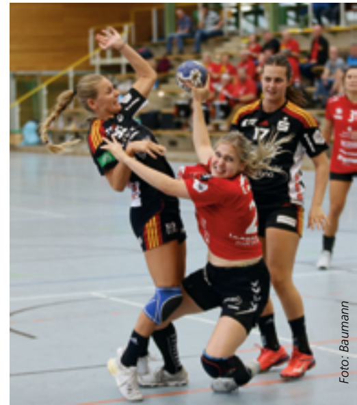
Top-Handballerinnen aus fünf Ländern gastieren in Ludwigsburg.

Favorit ist der TuS Metzingen. Der Dritte der letzten Bundesligasaison ist mit sechs Turniersiegen Rekordgewinner des LOTTO-Cups. Der siebte Erfolg wird den „TusSies“ am Wochenende nicht leicht gemacht. Neben fünf Rivalen aus der 1. und 2. Bundesliga wollen auch sechs internationale Spitzenmannschaften aus den Niederlanden, der Schweiz, Österreich und Tschechien Erster werden. Ei-