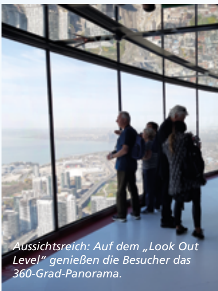
Aussichtreich: Auf dem „Look Out Level“ genießen die Besucher das 360-Grad-Panorama.

Der Horizont jagt vorbei, ein Vogel bekommt gerade noch die Kurve – in nur 58 Sekunden rasen die Aufzüge des CN Towers auf fast 350 Meter Höhe hinauf. Wer nicht schwindelfrei ist, schließt die Augen, denn die Front der Lifts ist jeweils verglast. So also fühlt es sich an, in einer Rakete Richtung Himmel zu fliegen. Die Knie sind weich, als