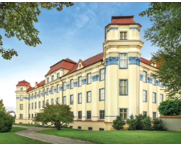
Im Neuen Schloss Tettang sind vier Epochen vereint.