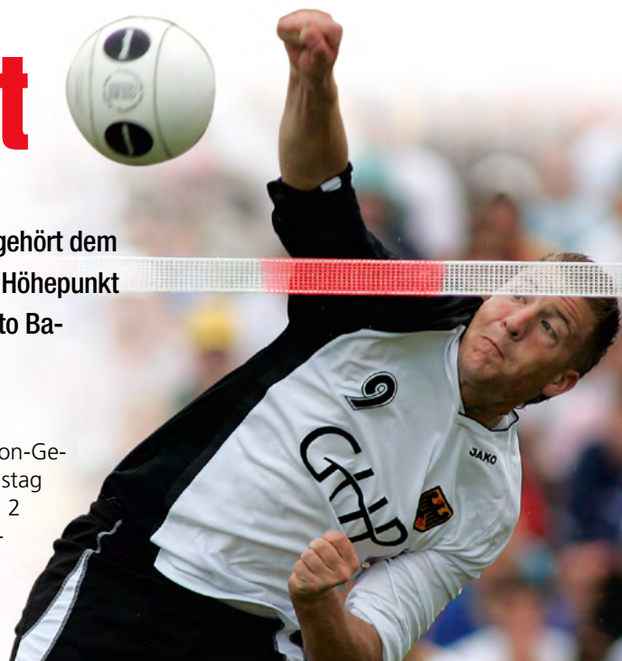
Bei der letzten EM in Baden-Württemberg wurden die deutschen Faustballer 2008 in Stuttgart-Stammheim „nur“ Dritter. In Adelmannsfelden soll es jetzt besser laufen.

arbeiter von Lotto Baden-Württemberg und deren Angehörige dürfen nicht teilnehmen.