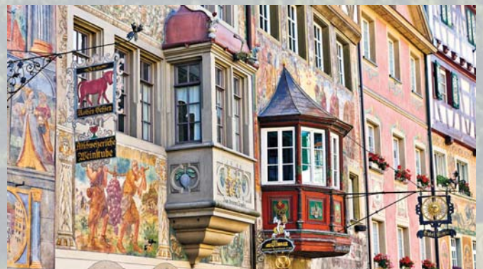
Bunte Fassadenmalereien in der mittelalterlichen Altstadt von Stein am Rhein.

Neben dem WM-Kurs hat der Hegau zahlreiche andere attraktive Mountainbike-Routen zu bieten. Grenzenloses Radeln verspricht der „50er“, angelegt von der „Schaffhauserland Tourismus“: Vier Etappen mit insgesamt 160 Kilometern, rund 2.800 Höhenmetern und mehreren Grenzübertritten. Einen der