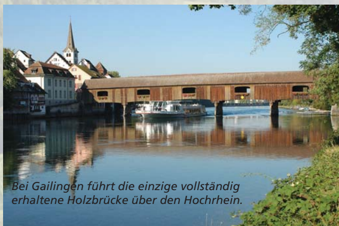
Bei Gailingen führt die einzige vollständig erhaltene Holzbrücke über den Hochrhein.