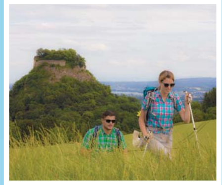
Erlebnis-Wandern vor dem Hohenkrähen, im Hintergrund schimmert der Bodensee.