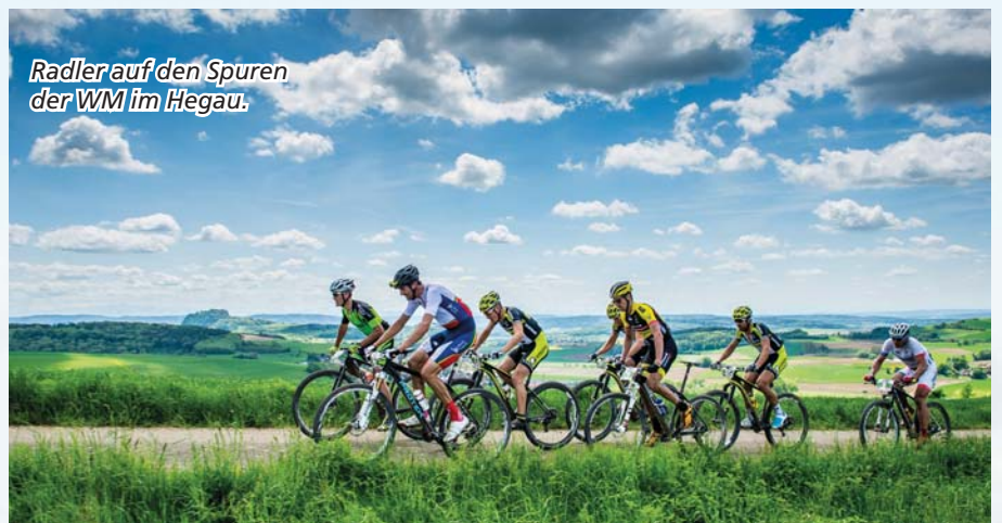
Radler auf den Spuren der WM im Hegau.

Am Schweinebuckel geht's ans Eingemachte! Mit 25 Prozent Steigung beißt sich der Feldweg in die Flanke des Plörens. Der Vulkan spuckt längst keine Lava mehr, dafür brennt das Feuer in den Waden der Mountainbiker. Doch das ist nur eine Momentaufnahme. Von oben bietet sich ein herrlicher Ausblick, der schnell alle Mühen vergessen lässt.