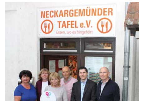
Die Neckargemünder Tafel wird die 5.000 Euro zum Kauf eines Autos verwenden, mit dem Lebensmittel von Spendern abgeholt werden sollen.