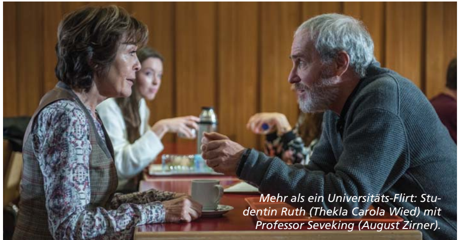
Mehr als ein Universitäts-Flirt: Studentin Ruth (Thekla Carola Wied) mit Professor Seveking (August Zirner).

Spätestens nach dem 3. November 1983 kannte fast jeder in Deutschland den Namen Thekla Carola Wied. An diesem Tag zeigte das ZDF die erste Folge der Fernsehserie „Ich heirate eine Familie“. Die Produktion mauserte sich zum Gassenhauer. Künftig waren die Schumanns in den Haushalten Pflichtprogramm. Angie (Thekla Carola Wied), Mutter von drei Kindern, heiratete den Playboy Werner (Peter Weck). Ein gemeinsames Kind kam hinzu. Das Patchwork-Modell stieß auf einen Zeitnerv und das Image der liebevollen Serienmama wurde die Tochter eines Lateinlehrers nie wieder los. Geschadet