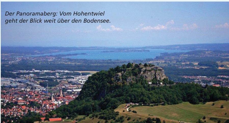
Der Panoramaberg: Vom Hohentwiel geht der Blick weit über den Bodensee.

schönsten Abschnitte erreicht man bei einer Tagestour leicht von Singen aus. Der Weg führt via Rielasingen in den Kanton Schaffhausen. Über den Schierberg mit grandiosen Panoramablick geht es in ursprünglicher Natur zurück nach Deutschland, anschließend wieder über die grüne Grenze ins mittelalterliche Schweizer Kleinod Stein am Rhein.