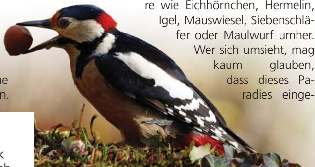
Der alte Baumbestand des Schönbuch ist ideal für Buntspechte.

Mehrere alte Handelswege durchqueren den Schönbuch. Einer davon ist die „Via Rheni“, die einst die großen Kaiserstädte Worms, Mainz und Speyer mit Oberitalien verband. Besucher lockt es heute auch in das ehemalige Zisterzienserkloster Bebenhausen. Dem Orden ist es zu verdanken, dass der Wald so ursprünglich geblieben ist. Von der Gründung im Jahr 1183 bis zur Reformation gehörte ein großer Teil des Schönbuchs zum Kloster und blieb daher fast unberührt.