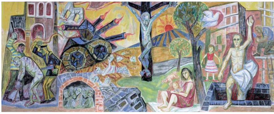
Fünf Meter hoch und zwölf Meter breit: „Krieg und Frieden“, das einzig erhaltene Wandbild von Otto Dix schmückt den Ratssaal in Singen.