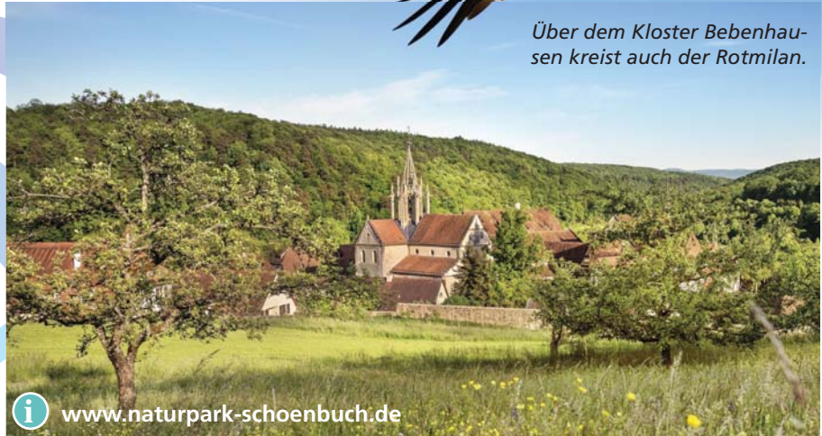
Über dem Kloster Bebenhausen kreist auch der Rotmilan.

Gespenster passen ausnehmend gut in diese magische Landschaft, die von atemberaubend großen Bäumen geprägt wird. Zu ihnen gehört die Sulzeiche bei Waldorfhäslach. Seit mehr als 400 Jahren trotz der bildschöne Baum Wind und Wetter. Die Eiche ist keine Ausnahme, viele ihrer Artgenossen erreichen hier ein ähnlich hohes Alter. Dass es diese Riesen hier gibt, ist einer besonderen Form der Weidewirtschaft zu verdanken. Die Bauern führten ihr Vieh in den Wald. Die sogenannten Hutebäume lieferten den Tieren schmackhafte Eicheln. Weil junge Triebe sofort abgeweidet wurden, konnten monumentale Bäume ungestört weiter wachsen.