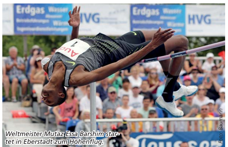
Weltmeister Mutaz Essa Barshim startet in Eberstadt zum Höhenflug.