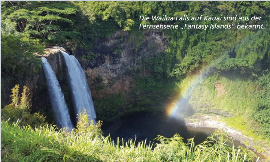
Die Wailua Falls auf Kauai sind aus der Fernsehserie „Fantasy Islands“ bekannt.

Ich bin verliebt! In ein urzeitlich anmutendes Tier, das trotz seiner Größe friedlich um mich herum paddelt. Meine neue Freundin ist erstaunlich schnell unterwegs. Mal schaut der Schildkrötenkopf rechts von mir aus dem Wasser, dann sehe ich auf der anderen Seite gerade noch wie sie wieder abtaucht. Anfassen ist streng verboten, menschliche Berührungen können Meeresschildkröten krank machen, ja sogar töten. Mir reicht das Zuschauen ohnehin völlig aus. Hawaii tut gut.