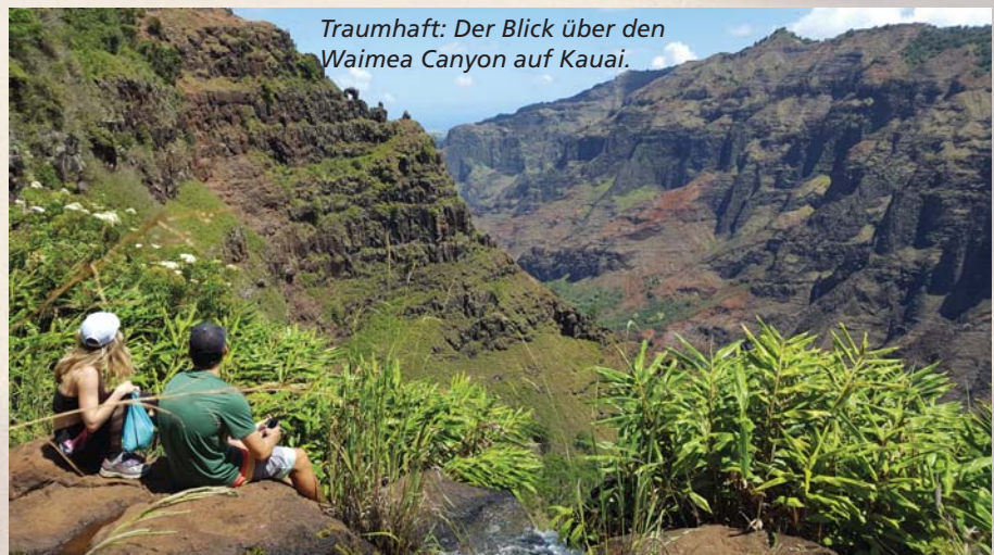
Traumhaft: Der Blick über den Waimea Canyon auf Kauai.