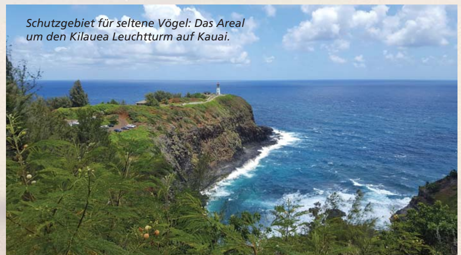
Schutzgebiet für seltene Vögel: Das Areal um den Kilauea Leuchtturm auf Kauai.

Am Nachmittag schlendern wir durch die Straßen der alten Walfängerstadt Lahaina. Mehr als 3.000 majestätisch anmutende Buckelwale ziehen zwischen Januar und