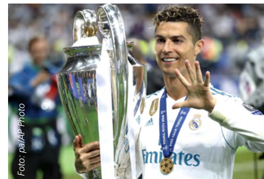
Nach drei Champions-League-Siegen in Folge verließ Cristiano Ronaldo Madrid. Glückt mit Juventus der nächste Coup?

In der Europa League ist die Bundesliga mit drei Teams vertreten. Bayer Leverkusen qualifizierte sich als Bundesliga-Fünfter, Eintracht Frankfurt als Pokalsieger und RB Leipzig über die Qualifikationsrunde. Sie alle blicken nach Osten: Das Finale der Europa League wird am 29. Mai 2019 in Aserbaidschans Hauptstadt Baku angepfeifen.