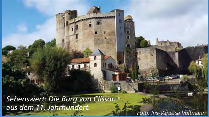
Sehenswert: Die Burg von Clisson aus dem 11. Jahrhundert.