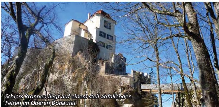
Schloss Bronnen liegt auf einem steil abfallenden Felsen im Oberen Donautal.

Zu den „tierisch“ schönen Seiten rund um das berühmte Benediktinerkloster Beuron zählen neben Rehen und Füchsen auch die in freier Wildbahn bei uns sonst eher selten vorkommenden Uhus, Gämsen oder gar Luchse. Angenagte Bäume am Ufer von Bachläufen belegen, dass im Donautal seit einigen Jahren wieder Biber heimisch sind. Auch deren Motto: Rein ins Abenteuerland!