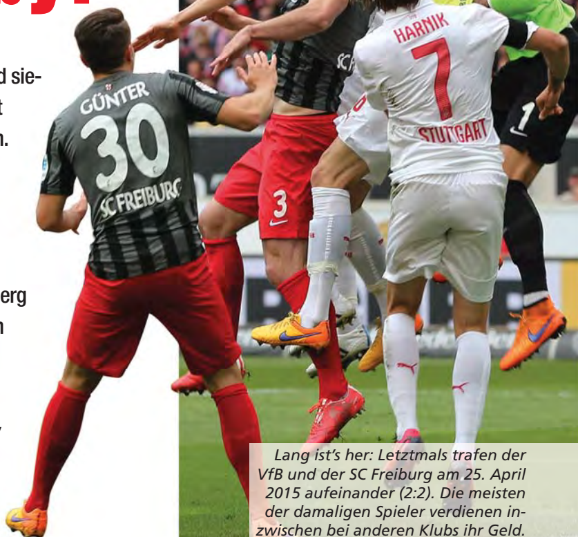
Lang ist's her: Letztmals trafen der VfB und der SC Freiburg am 25. April 2015 aufeinander (2:2). Die meisten der damaligen Spieler verdienen inzwischen bei anderen Klubs ihr Geld.

Die Teilnahme von Lotto-Mitarbeitern und deren Angehörigen sowie der Rechtsweg sind ausgeschlossen.