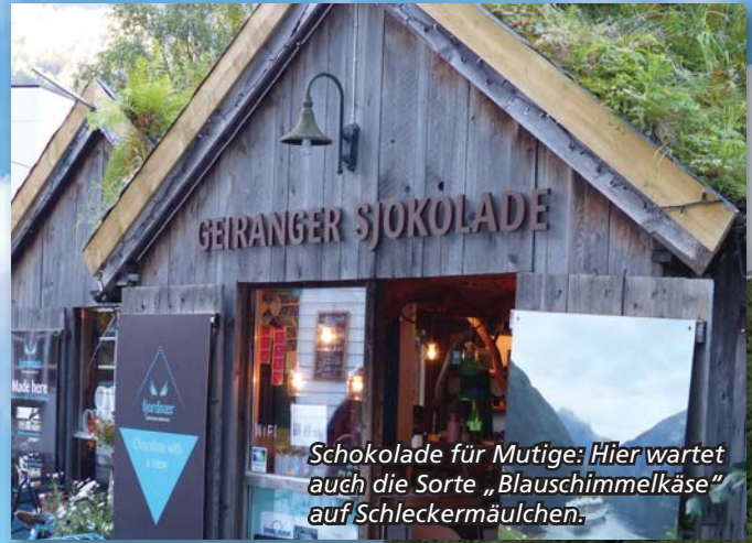
Schokolade für Mutige: Hier wartet auch die Sorte „Blauschimmelkäse“ auf Schleckermäulchen.

Sherlock Holmes-Erfinder Sir Arthur Conan Doyle stiegen hier ab. In ihren einstigen Zimmern kann man auch heute noch fürstlich schlafen. Eine Geschichte hören alle Gäste, schließlich kann nicht jedes Hotel von sich behaupten ein Gespenst zu besitzen. Eine unglückliche Geliebte spukt in einem Eckzimmer mit Blick auf den wunderschönen Norangsfjord.