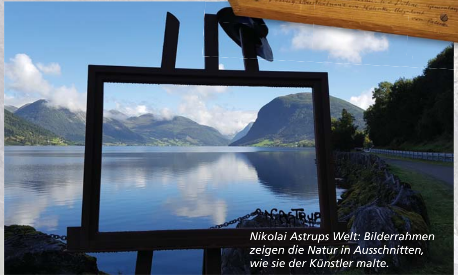
Nikolai Astrups Welt: Bilderrahmen zeigen die Natur in Ausschnitten, wie sie der Künstler malte.