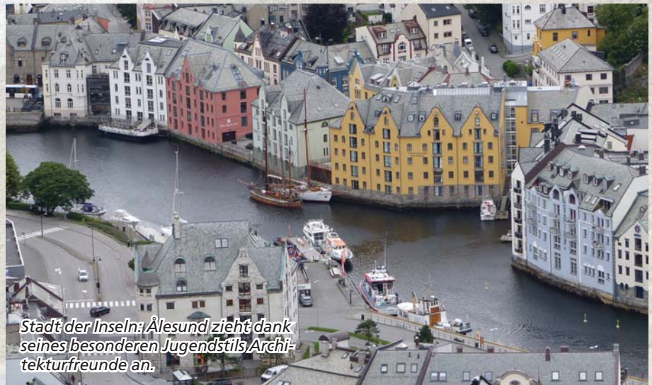
Stadt der Inseln: Ålesund zieht dank seines besonderen Jugendstils Archi- tekturfreunde an.

auf dem vom Wind gekräuselten Nordmeer – und dort, ist das nicht..., nein, aber der Felsen sieht einem Troll ziemlich ähnlich. Wir tauchen in die Wolken ein und ich gebe mich meinen Erinne-