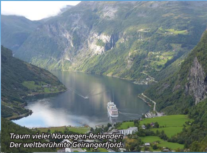
Traum vieler Norwegen-Reisender: Der weltberühmte Geirangerfjord.