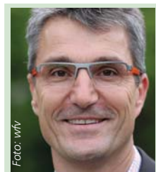
Knut Kircher Ex-FIFA- und DFB-Schiedsrichter, 244 Bundesliga-Spiele, tippt:

Form: s/S = Sieg, u/U = Unentschieden, n/N = Niederlage, kleine Buchstaben = Heimspiel, große Buchstaben = Auswärtsspiel, (F) = Frauen. Wertung nach der regulären Spielzeit (Verlängerungen werden nicht berücksichtigt). Zahlen in Klammern = Tabellenstand.