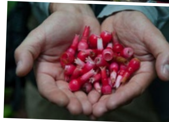
Mit einem „Luft-Fahrrad“ geht es bei der Mashpi Lodge durch den Regenwald (oben). Dabei sind auch seltsame Blüten zu entdecken (unten). Auf dem Indiomarkt von Otavalo werden Hüte in allen Farben und Formen verkauft (Mitte).