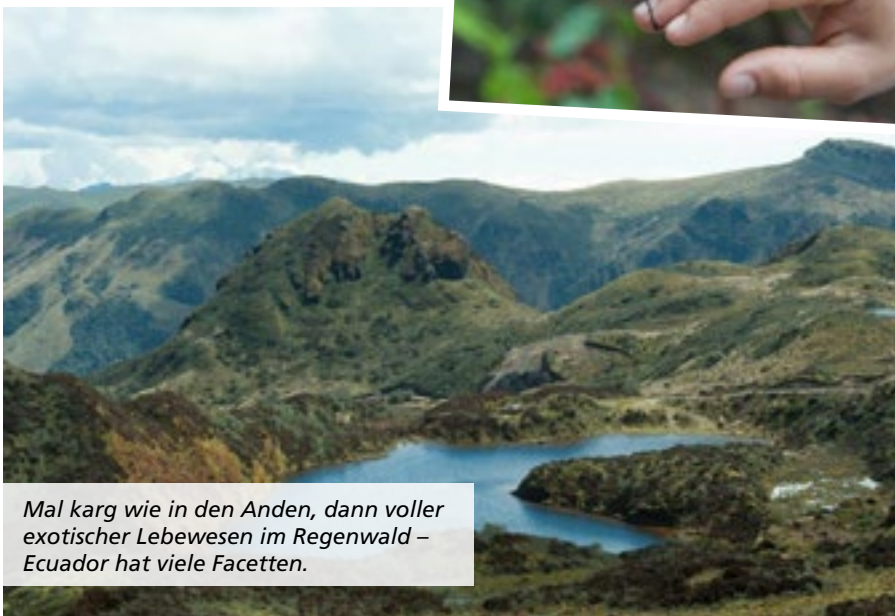
Mal karg wie in den Anden, dann voller exotischer Lebewesen im Regenwald – Ecuador hat viele Facetten.