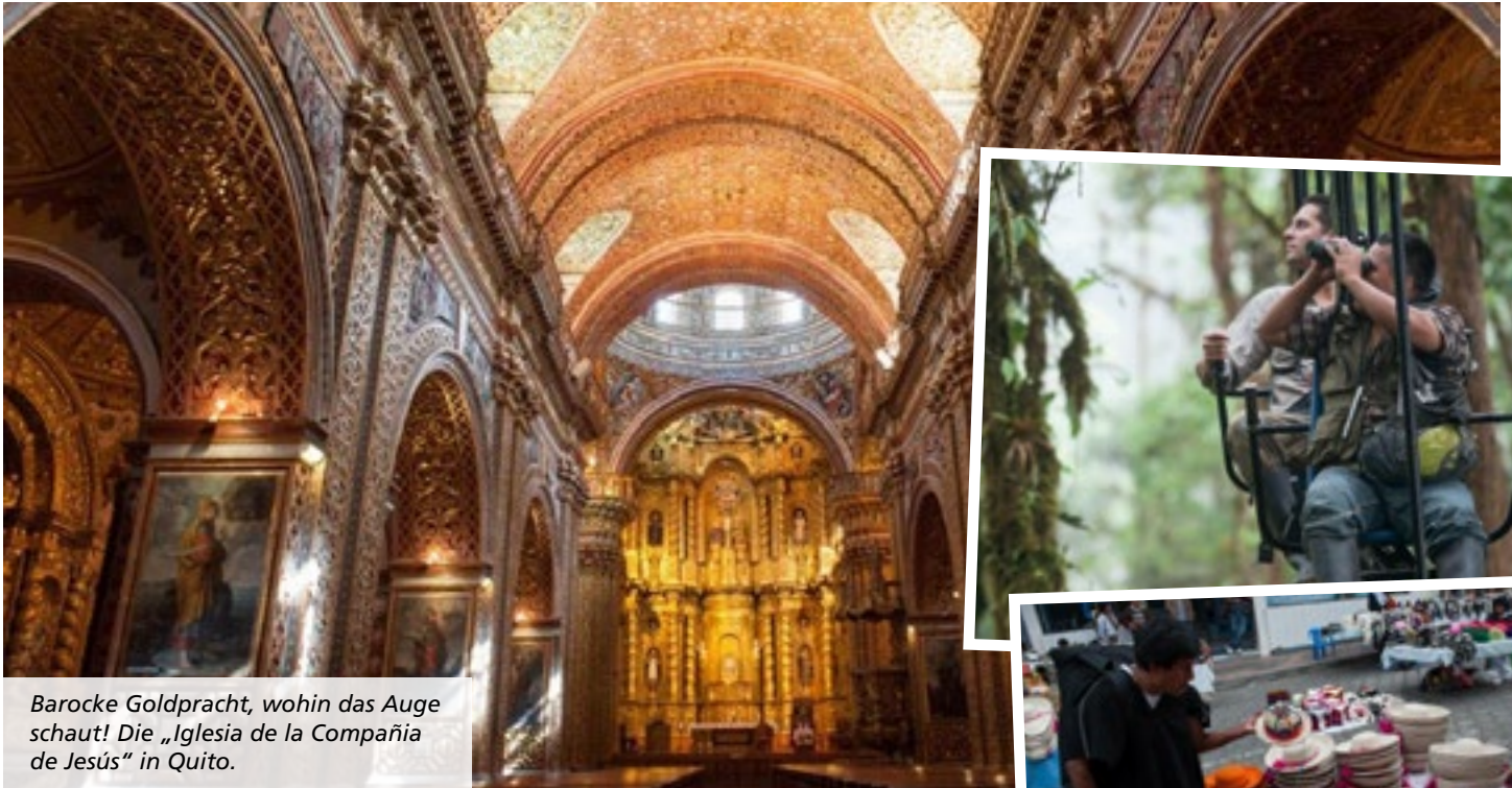
Barocke Goldpracht, wohin das Auge schaut! Die „Iglesia de la Compañía de Jesús“ in Quito.

wurde zum Treffpunkt von Drogenhändlern und Prostituierten. „Inzwischen ist das Herz von Quito aber wieder sicherer geworden. Plötzlich ist es schick, in den historischen Gebäuden zu wohnen und zu arbeiten.“