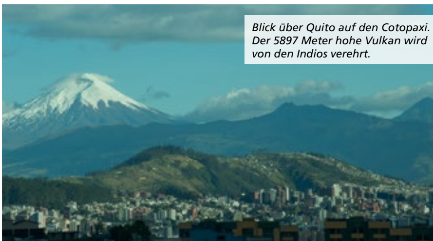
Blick über Quito auf den Cotopaxi. Der 5897 Meter hohe Vulkan wird von den Indios verehrt.