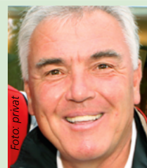
Herbert Rudel Sportfotograf aus Stuttgart, Fan vom VfB Stuttgart, Tipp: