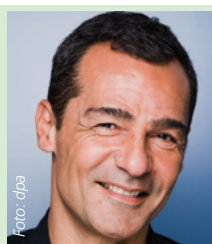
Erol Sander Schauspieler, u. a. „Mordkommission Istanbul“, Bayern-Fan, Tipp:

grün = Gewinnspiele 6aus45 Auswahltipp, * = Zusatzspiel, E = Ersatzauslosung