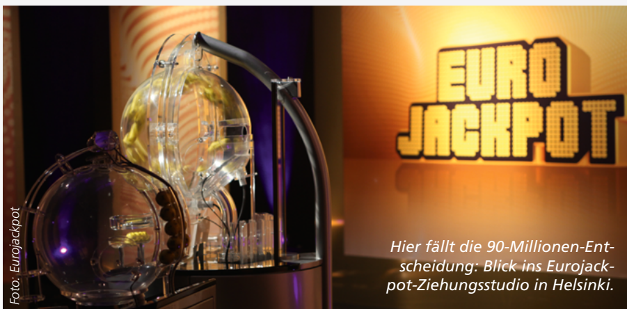
Hier fällt die 90-Millionen-Entscheidung: Blick ins Eurojackpot-Ziehungsstudio in Helsinki.

Falls Sie Ihr Glück mit diesem System probieren wollen, sollten Sie die Zahlen der Grundform 1 bis 11 durchgängig mit Ihren eigenen Glückszahlen ersetzen.