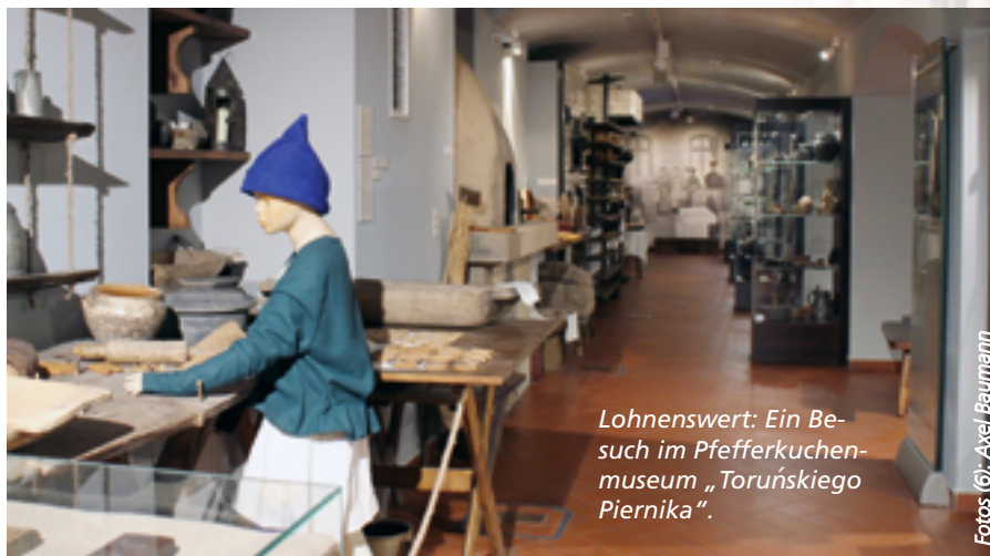
Lohnenswert: Ein Besuch im Pfefferkuchenmuseum „Toruńskiego Piernika“.