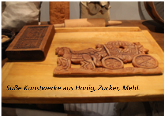
Süße Kunstwerke aus Honig, Zucker, Mehl.