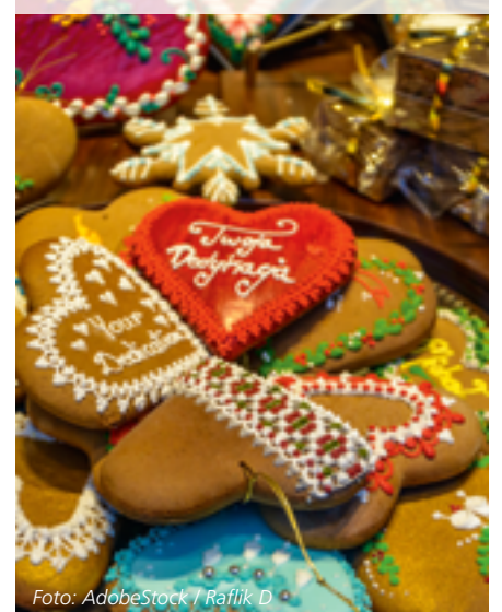
Pfefferkuchen-Kreationen aus Toruń.