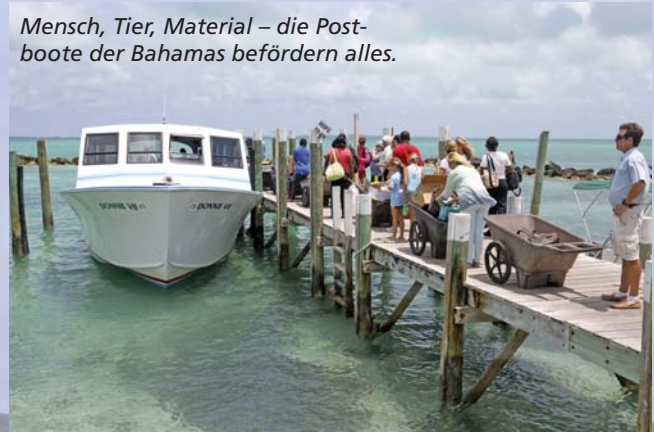
Mensch, Tier, Material – die Postboote der Bahamas befördern alles.

aus dem drittgrößten Weinkeller der Welt und zündet man sich eine Zigarre an, kommt sie aus der hauseigenen Fabrik. Warum nicht!? Wer mehr auf Frischluft steht: Beliebte Treffpunkte der Einheimischen sind die Strände Cable Beach und Great Esplanade Beach.