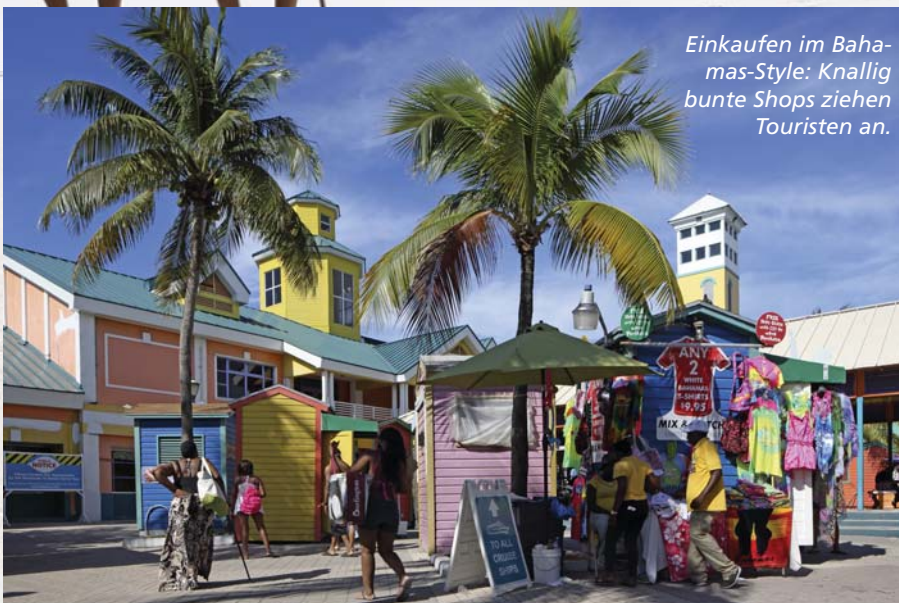
Einkaufen im Bahamas-Style: Knallig bunte Shops ziehen Touristen an.