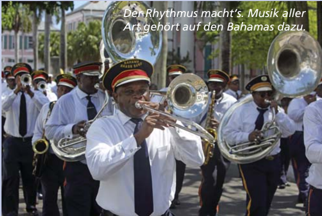
Der Rhythmus macht's. Musik aller Art gehört auf den Bahamas dazu.