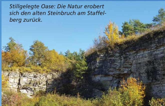
Stillgelegte Oase: Die Natur erobert sich den alten Steinbruch am Staffelberg zurück.

den salzigen Duft in der Nase. Der Stress versickerte irgendwo ganz weit unten im Schwimmbecken. Wir profitieren von einem geschickten Arrangement. Seit einem Jahr verbindet der Bademantelgang unser Best Western Plus Kurhotel mit der Obermain Therme. Jeder Hotelgast darf nun pro Übernachtung drei Stunden kostenlos im warmen Wasser entspannen. Wer will da schon nein sagen? Darüber hinaus gehört zum Bad eine ausgedehnte Saunananlage mit mehreren Becken und viel Platz zum Ausruhen. Viele Gäste legen extra wegen ihr einen Stop in Bad Staffelstein ein.