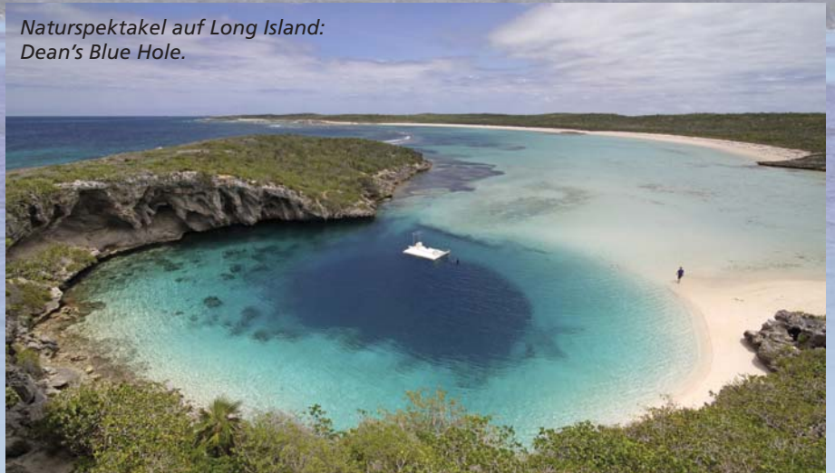
Naturspektakel auf Long Island: Dean's Blue Hole.

amin- und proteinreich. (Zuhause kann man es auch mit rohen Auberginenwürfeln zubereiten.) Irgendwann mache ich mich auf den Weg zum Hotel und schwinge selbst im Rhythmus, so lange die Musik zu hören ist.