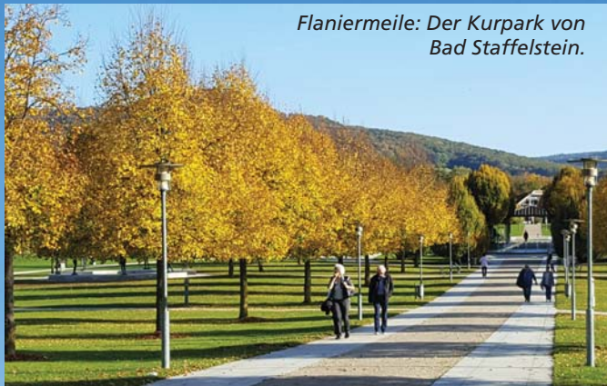
Flaniermeile: Der Kurpark von Bad Staffelstein.