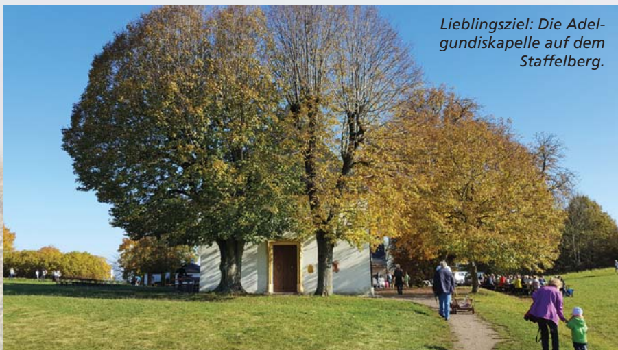
Lieblingsziel: Die Adelgundiskapelle auf dem Staffelberg.

Ich fühle mich dank einer Wellnesskur am Vorabend gut gerüstet. Nach der Nackenmassage im Wellnessbereich der Therme, entspannte ich im warmen Wasser. Schwerelos treibend wie im Toten Meer,