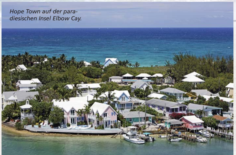
Hope Town auf der paradiesischen Insel Elbow Cay.

der 350.000 Bahamians leben. Die meisten sind afrikanischer Abstammung. Abseits der Souvenirshops und Märkte entlang der Anlegestelle der Kreuzfahrtschiffe drängt sich die Stadt nicht auf, sondern will entdeckt werden. Nahe der von Bankgebäuden dominierten Downtown hat sie ihren kreolischen Charme bewahrt. Da ist das alte, ehrwürdige Graycliff Hotel. Ein Relikt aus einer Zeit als Reisen einen Gang langsamer war. Der Pool schimmert in einem tropischen Garten blau, im Restaurant ordert man