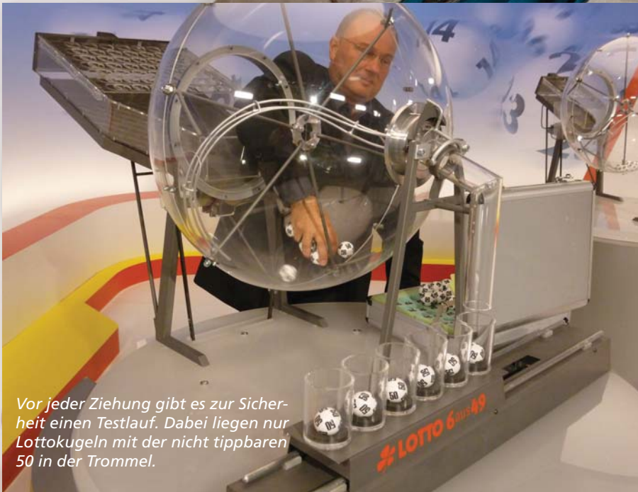
Vor jeder Ziehung gibt es zur Sicherheit einen Testlauf. Dabei liegen nur Lottokugeln mit der nicht tippbaren 50 in der Trommel.