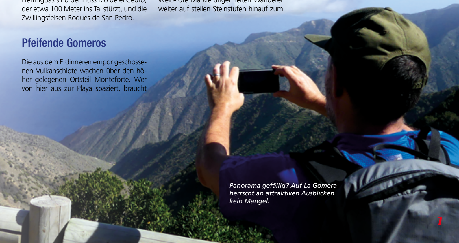
Panorama gefällig? Auf La Gomera herrscht an attraktiven Ausblicken kein Mangel.