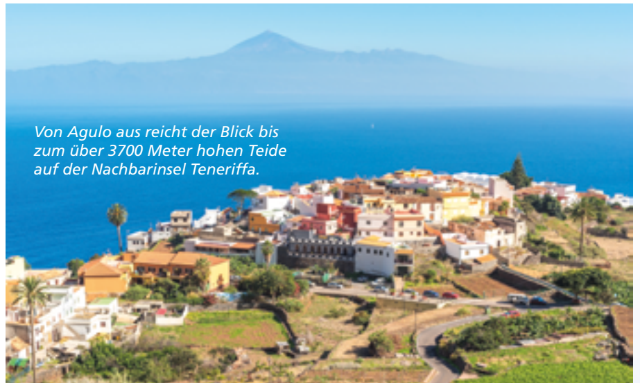
Von Agulo aus reicht der Blick bis zum über 3700 Meter hohen Teide auf der Nachbarinsel Teneriffa.

Der „Weg zur Erkenntnis“ führt über Teneriffa. Von Los Cristianos im Süden der Insel legt dreimal täglich der Olson Express nach La Gomera ab. Knapp eine Stunde dauert die Fährfahrt nach San Sebastián, der Inselhauptstadt. Nach einer