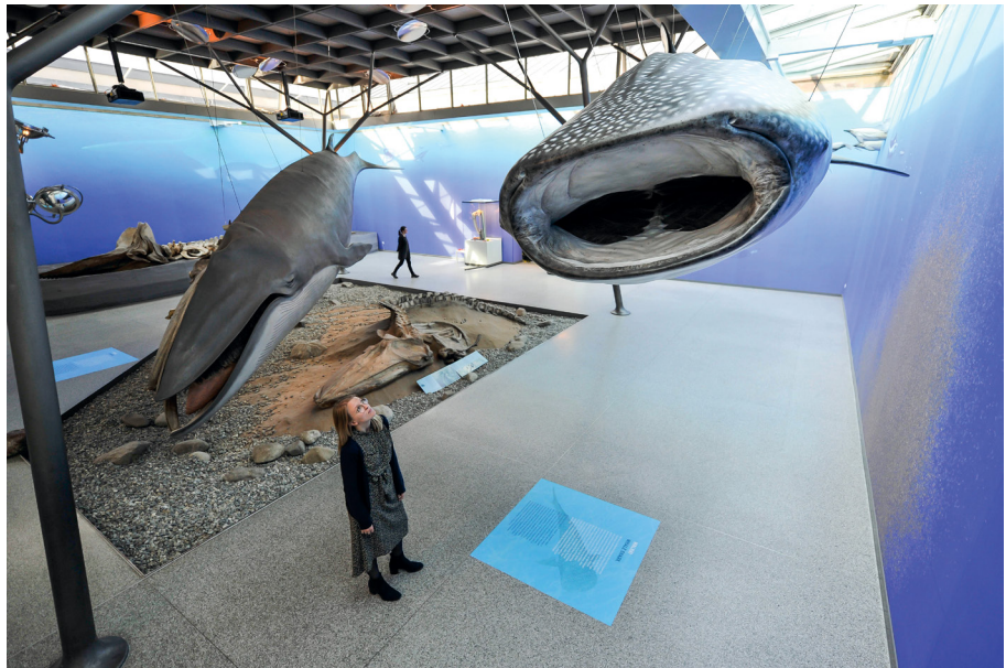
Im Stuttgarter Schloss Rosenstein können Besucher in die Welt der Ozeane eintauchen und ihre riesigen Bewohner bestaunen.

Die Giganten unter den Meerestieren sind die Wale. Um den gut 13 Meter langen Seiwal können die Gäste der Ausstellung gemütlich herumlaufen. Der elegante Meeressäuger fasziniert durch seine Stromlinienform und gibt Einblicke in sein Innenleben. Auch Haie „schwimmen“ durch das Museum: der planktonfressende Walhai und der ebenso gefürchtete wie seltene Weiße Hai.