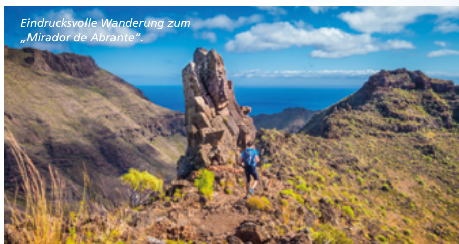
Eindrucksvolle Wanderung zum „Mirador de Abrante“.

Das Herz von La Gomera ist ein subtropischer Urwald, ein Wasserspeicher, der ein Zehntel der Insel bedeckt. In seinem Zentrum liegt der Nationalpark Garajonay, der einen über 1000 Jahre alten Lorbeerwald schützt. Mit jedem Schritt hinein in den ehemaligen Vulkankrater wird die Luft kühler, die Atmosphäre mystischer. Riesige Farne und knorrige, ganz von Moos überzogene Bäume schaffen eine Filmkulisse wie für „Herr der Ringe“. Je tiefer die Pfade in den Krater führen, desto länger werden die Moosbärte. Sie speichern die