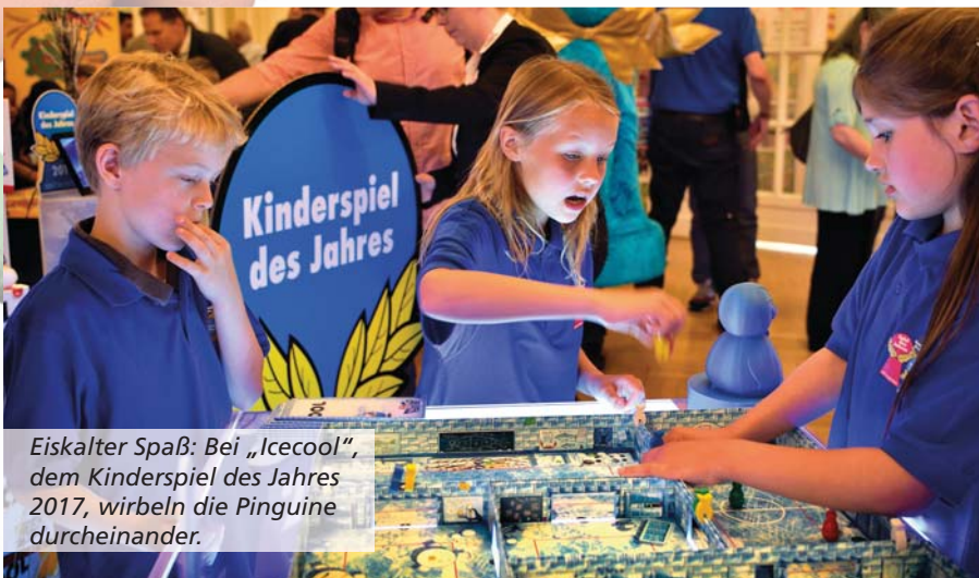
Eiskalter Spaß: Bei „Icecool“, dem Kinderspiel des Jahres 2017, wirbeln die Pinguine durcheinander.

Escape Rooms sind en vogue. Ein Team muss gemeinsam einen Weg aus einem verschlossenen Raum finden. „Exit“, das Kennerspiel des Jahres 2017, greift diese Idee mit drei verschiedenen Titeln auf. Die Spieler lösen mehrere Rätsel, um schließlich die finale Knobelaufgabe zu bestehen. Je schneller das Team, desto besser die Bewertung.