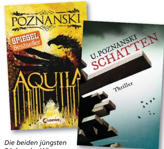
Die beiden jüngsten Bücher der Wiener Autorin: „Aquila“, erschienen bei Loewe, und „Schatten“ aus dem Wunderlich-Verlag.

Viel zu schnell ist die Zeit um. Ursula Poznanski muss gehen. Spä-