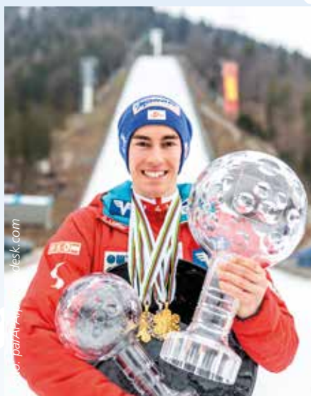
Alles abgeräumt: Stefan Kraft wurde im letzten Winter Doppelweltmeister und gewann auch die Weltcups im Skispringen und Skifliegen.

In den ersten Springen dieser Saison blieben die erfolgsverwöhnten deutschen Adler zwar ohne Sieg, zeigten aber schon gute Leistungen. Beim Auftakt im polnischen Wisla belegten das DSV-Team und Richard Freitag jeweils vierte Plätze. Danach verbesserte sich die Mannschaft im finnischen Ruka auf Rang zwei, Andreas Wellinger wurde Dritter. Ebenfalls in den „Top Ten“ landeten Markus Eisenbichler (5.), Richard Freitag (6.) und Stephan Leyhe (9.). Den verletzungsbedingten Ausfall von „Vorspringer“ Severin Freund haben die Athleten von Bundestrainer Werner Schuster bisher gut kompensiert. Für den Ein-