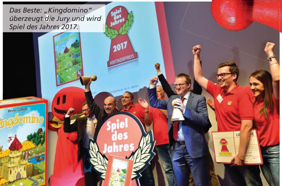
Das Beste: „Kingdomino“ überzeugt die Jury und wird Spiel des Jahres 2017.

W inter, Kälte, lange Nächte – wenn es draußen ungemütlich wird, ist es höchste Zeit für gute Spiele. Mit den Neuerscheinungen des Jahres 2017 steht vergnüglichen Stunden nichts mehr im Weg. Das glüXmagazin hat die Kataloge der Verlage durchforstet und eine bunte Mischung für Sie zusammengestellt. Mit dabei sind auch das Spiel des Jahres 2017 sowie die mit dem Deutschen Spielepreis gekürten Neuheiten.