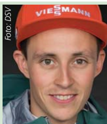
Eric Frenzel Nord. Kombination, Olympic- und Weltcupsieger, Fan von Erzg. Aue, tipp: 13

Form: s/S = Sieg, u/U = Unentschieden, n/N = Niederlage, kleine Buchstaben = Heimspiel, große Buchstaben = Auswärtsspiel, (F) = Frauen. Wertung nach der regulären Spielzeit (Verlängerungen werden nicht berücksichtigt). Zahlen in Klammern = Tabellenstand.