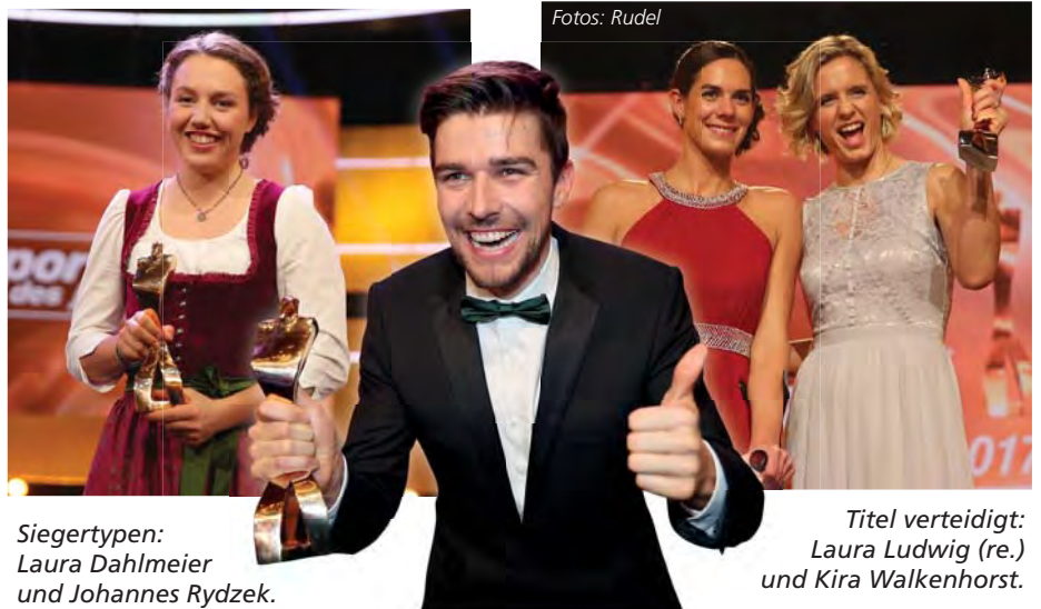
Siebertypen: Laura Dahlmeier und Johannes Rydzek.

R und 1.300 Sportjournalisten haben gewählt, die Proklamation der Gewinner fand vor 700 geladenen Gästen im Kurhaus von Baden-Baden statt. Die fünffache Weltmeisterin Laura Dahlmeier distanzierte die Konkurrenz nicht nur bei der Biathlon-WM in Hochfilzen, sondern auch bei der Sportlerwahl des Jahres 2017. Hinter der im feschen Dirndl auftretenden Skijägerin wurden die Turn-Weltmeisterin Pauline Schäfer Zweite und Dressur-Königin Isabella Werth Dritte. Auch bei den Männern