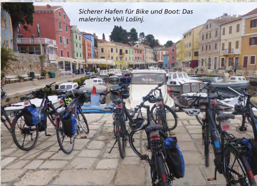
Sicherer Hafen für Bike und Boot: Das malerische Veli Lošinj.