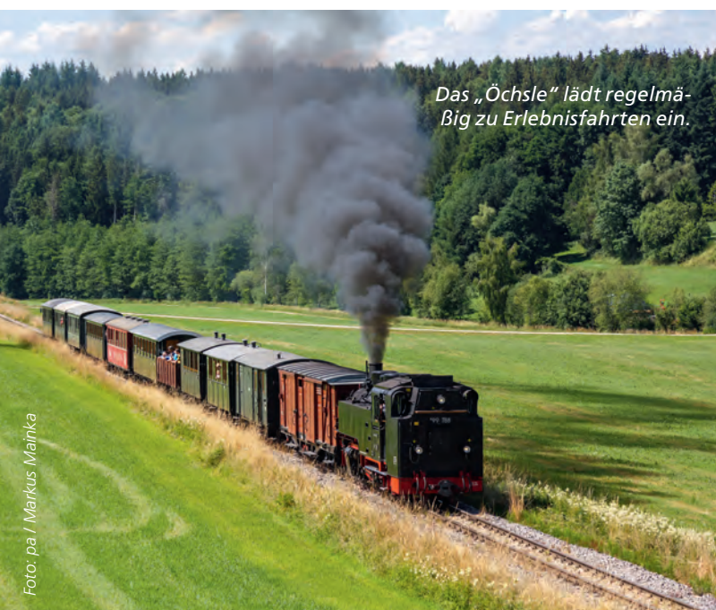
Das „Öchsle“ lädt regelmäßig zu Erlebnisfahrten ein.

Einst war sie des Härtsfelds „Anschluss an die Welt“, heute fährt sie ihre Fahrgäste durch das idyllische Egautal bis zum Härtsfeldsee: die Museumsbahn zwischen Neresheim und Katzenstein. Die Härtsfeld-Museumsbahn macht sich von Mai bis Oktober an jedem ersten Sonntag und an ausgewählten Zusatztagen, wie dem Tag des offenen Denkmals, auf die Reise. Der Fahrpreis auf der Vollstrecke beträgt 10 Euro, die Fahrt auf der Teilstrecke kann bereits für 7 Euro angetreten werden. Weitere Informationen finden Sie unter hmb-ev.de . Und wenn Sie schon mal da sind, lohnt sich auch ein Besuch bei den von Lotto Baden-Württemberg unterstützten Heimattagen Baden-Württemberg, die noch bis zum 21. November auf dem Härtsfeld stattfinden.