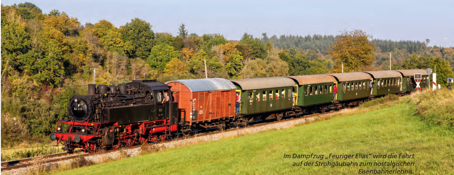
Im Dampfzug „Feuriger Elias“ wird die Fahrt auf der Strohäubahn zum nostalgischen Eisenbahnerlebnis.