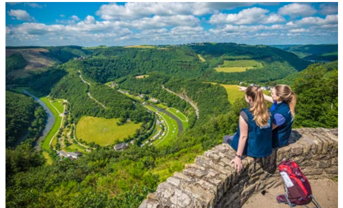
Toller Ausblick von der Burgruine Bourscheid ins Tal der Sauer.

Am Fließchen Our treffen sich Ardennen und Eifel, Luxemburg und Deutschland im „NaturWanderPark deluxe“. Teilweise grenzüberschreitende Touren führen durch beeindruckende Mittelgebirgslandschaften, vorbei an Flüssen und Seen zu mittelalterlichen Burgen und Schlössern. Im Norden des Landes